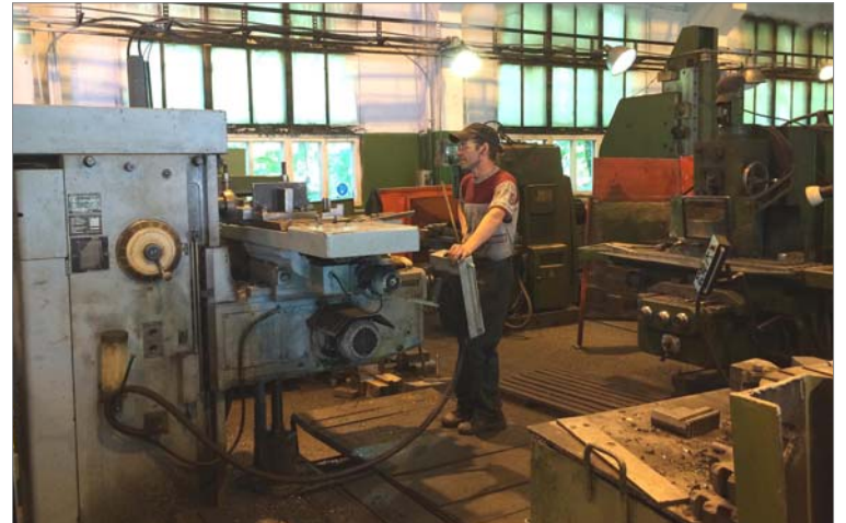
На участке прессформ механолитейного цеха.