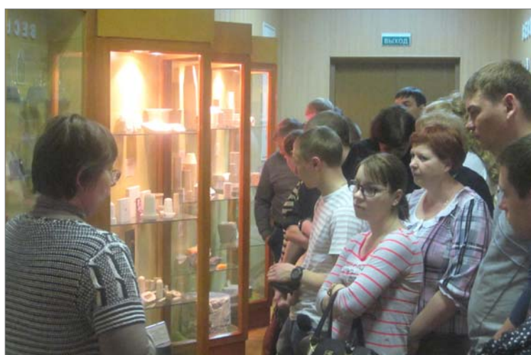
Автор материалов Алла ПОТАПОВА

Такие встречи помогают больше узнать о предприятии, на котором мы трудимся, почувствовать причастность к его истории и тем традициям, которые продолжают.