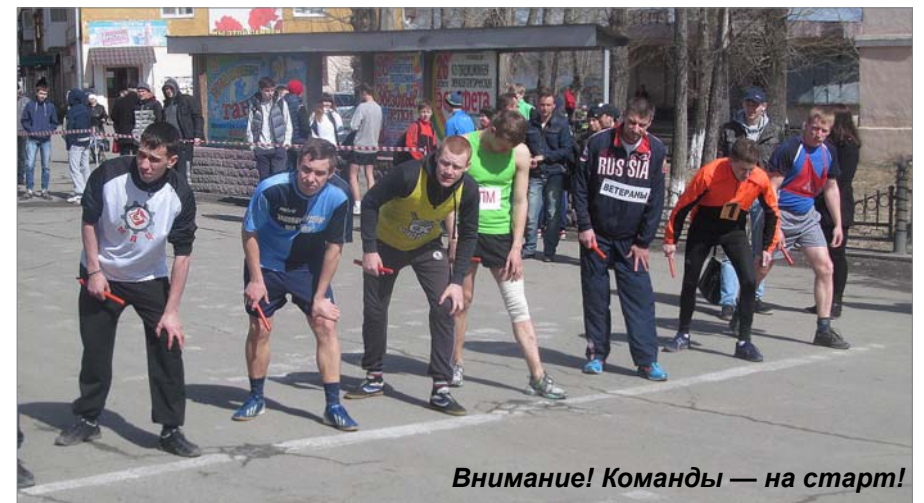
Внимание! Команды — на старт!

Переходящий Кубок - вновь остался у первого цеха. Грамота, медали, подарки и огромное удовлетворение от победы. Они уверенно шли к ней, и всё получилось.