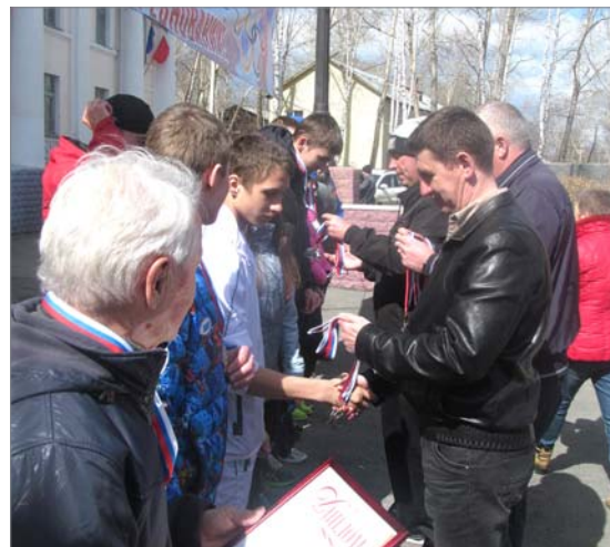
Награды победителям вручают руководители заводских подразделений.

Переходящий Кубок - вновь остался у первого цеха. Грамота, медали, подарки и огромное удовлетворение от победы. Они уверенно шли к ней, и всё получилось.