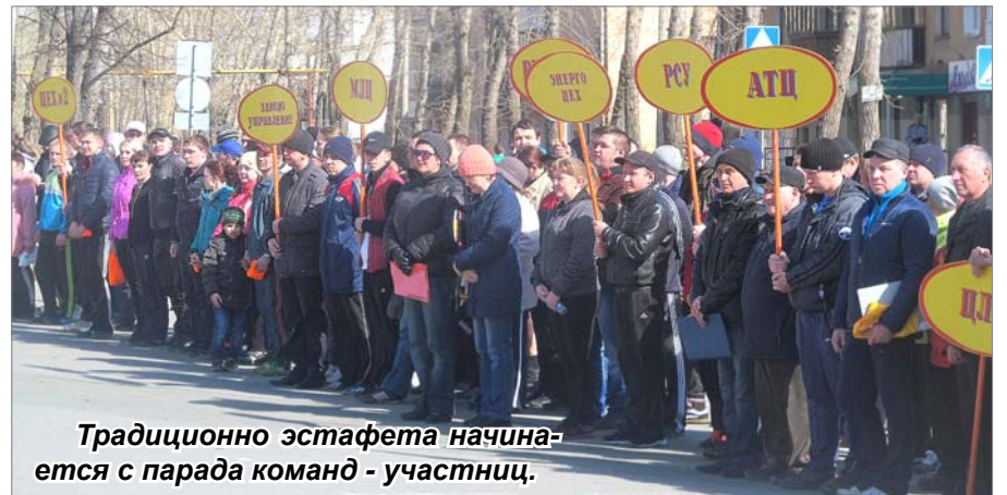
Традиционно эстафета начинается с парада команд - участниц.