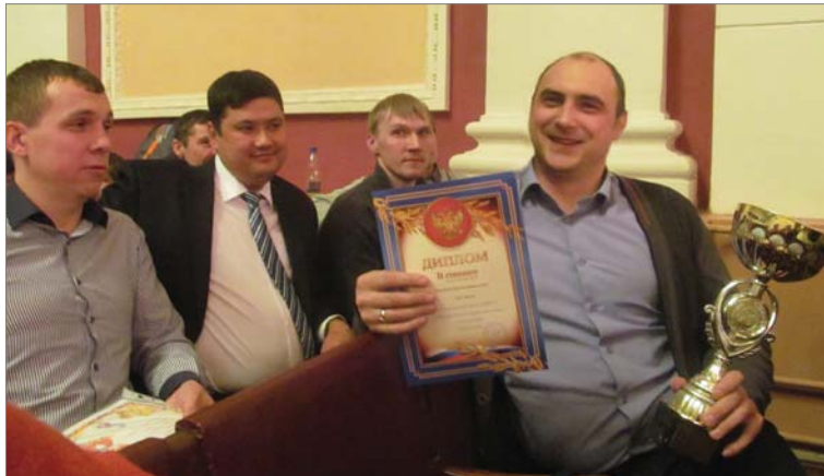
Заслуженный трофей. Команда заводоуправления - вторая в Спартакиадах трудящихся и руководителей.

На сцену поднимались лучшие воспитанники секций заводского спорткомплекса - футбольной, тхэквондо, армрестлинга. Зал приветствовал призёров Спартакиад - городской и обкома