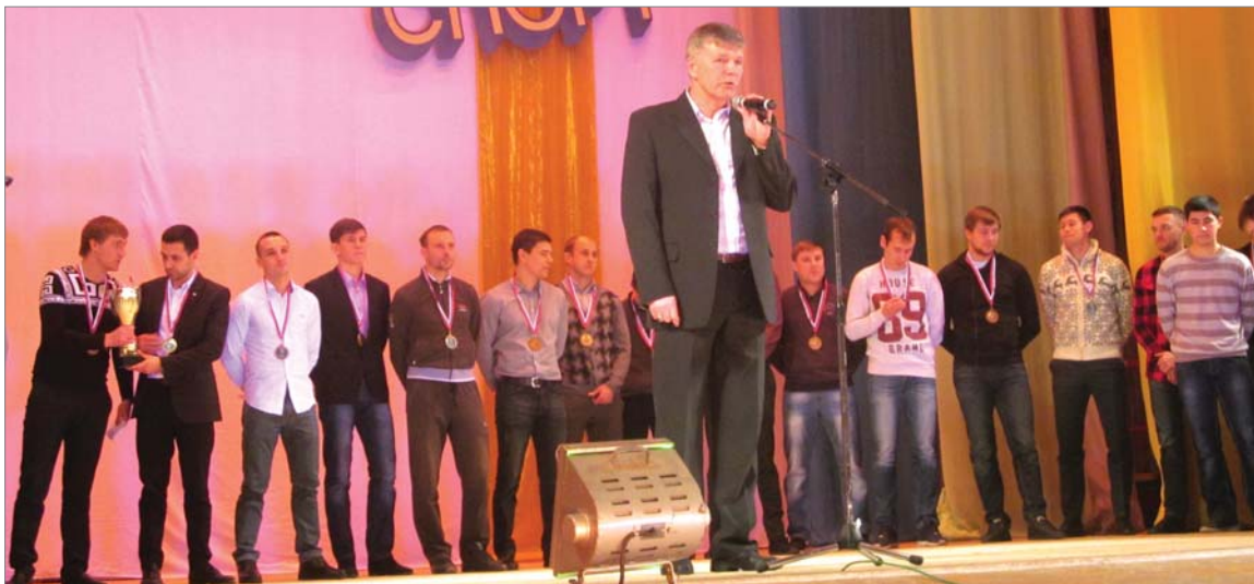
Футболисты «Динура» - бронзовые призёры областного чемпионата, команда в очередной раз доказала, что она - сильнейшая в городе.