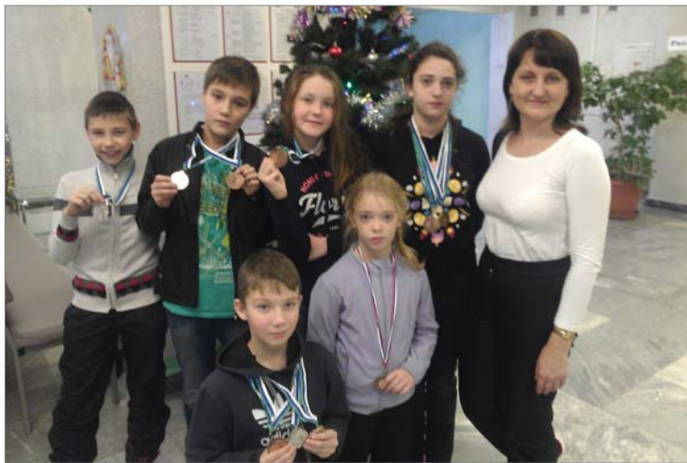
С воспитанниками - победителями и призёрами Открытого первенства Северского трубного завода.