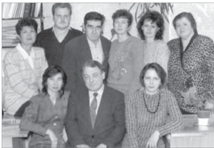
Коллеги, ставшие друзьями.