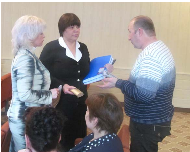
После конференции участники не расходились. Хотелось обсудить услышанное, поделиться впечатлениями, мнениями по тем вопросам, которые ближе всего.