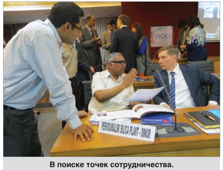
В поиске точек сотрудничества.

В состав делегации наряду с членами областного правительства были включены руководители предприятий области, по-