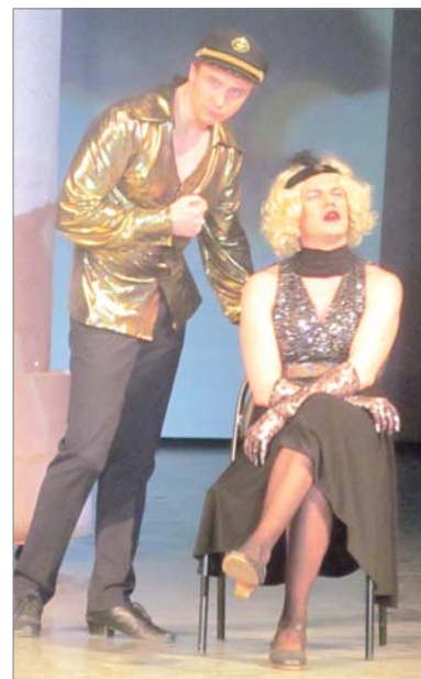
Автор материалов Жанна БУТРИМОВА

Все денежные средства от продажи билетов пойдут на проведение Грантового конкурса среди некоммерческих организаций города в мае этого года. Еще один спектакль будет показан 29 марта в 19 часов.