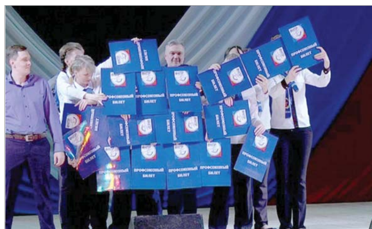
Обладатели Гран-при: команда ОАО «Курганмашзавод», город Курган (на снимке сверху) и агитбригада Уралвагонзавода, Нижний Тагил.