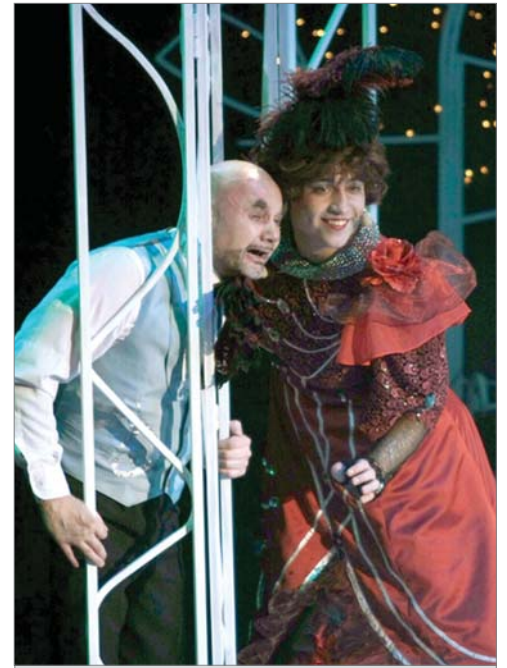
Сцена из спектакля.

«Мюзикл смешной – сюжет пьесы мы знаем, благодаря известному фильму «Здравствуй, я ваша тётя». Артисты показали очень высокий уровень мастерства – пели и танцевали замечательно. Главный герой был превосходен, ему блестяще удался образ студента, переодетого тётушкой донной Люцией – движения, жесты, «виляния». Был полный зал зрителей разного возраста. Все смеялись и аплодировали с восторгом.