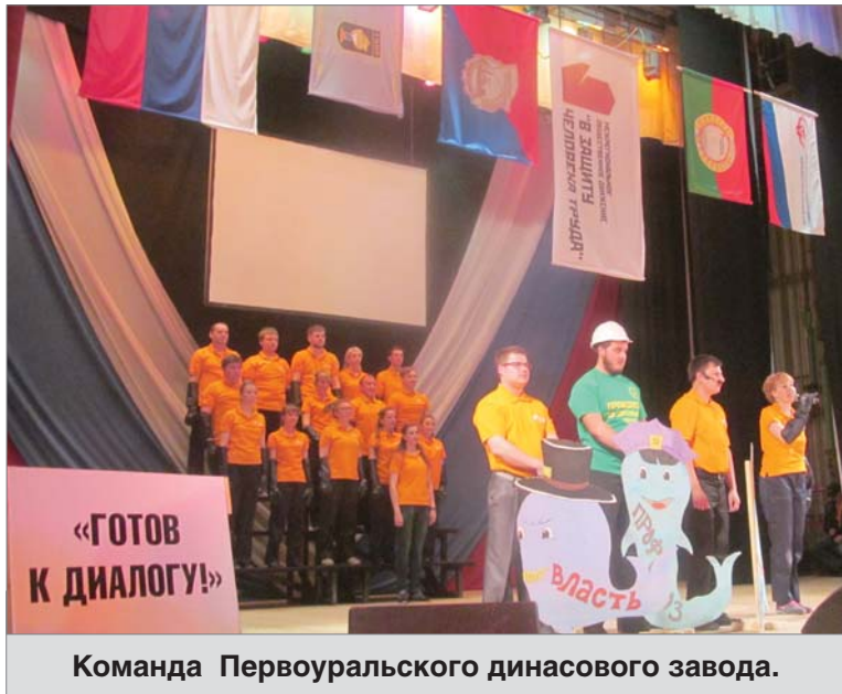
Команда Первоуральского динасового завода.

23 апреля во Дворце культуры «Огнепорщик» прошёл VIII Всероссийский конкурс профсоюзных агитбригад «Профсоюзы – за достойный труд», организованный Федерацией профсоюзов Свердловской области.