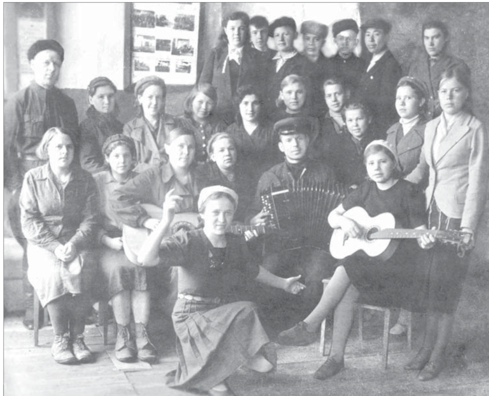
Заводская молодёжь в клубе.