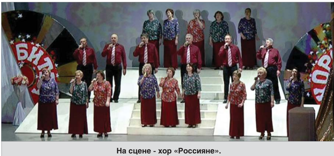
На сцене - хор «Россияне».

Во Дворце культуры Новотрубного завода во вторник состоялся конкурс Битва хоров «Под софитами». Это уже четвёртый сезон проекта, объединившего творческих первоуральцев.