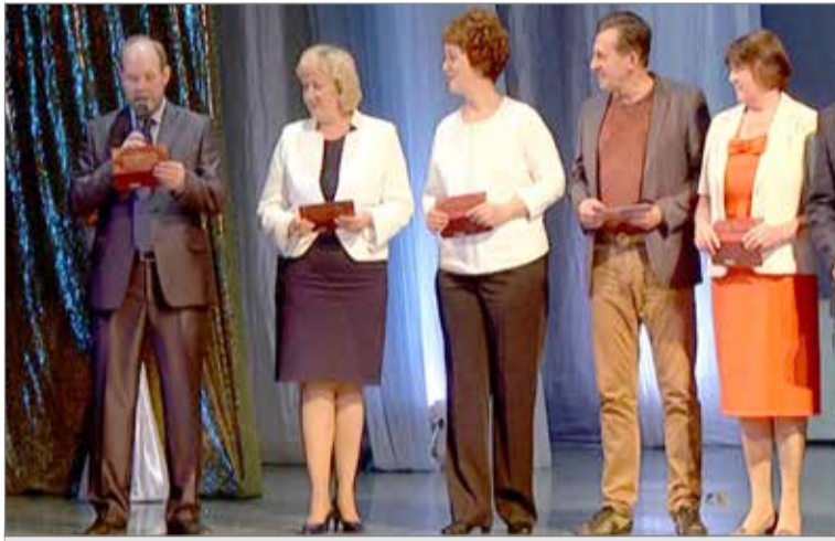
Представители «взрослой» больницы поздравляют детскую.