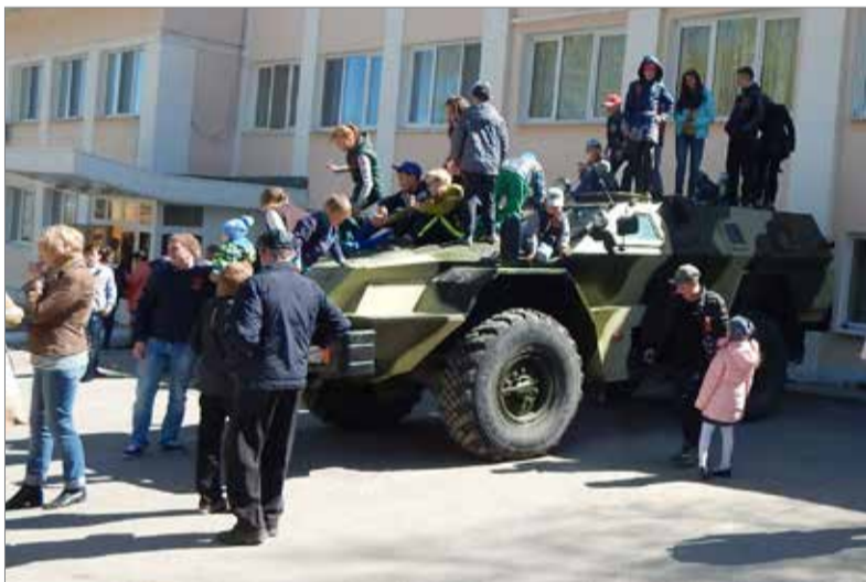
Не только мальчишки с интересом забирались на бронемашину и рассматривали автоматы.

После митинга люди долго не расходились. Ребятыня с любопытством разглядывала выставку оружия, лазала по военной технике. К полевой кухне за вкусной кашей выстроилась большая очередь. Многие пошли на праздничный концерт в ДК «Огнеупорщик», другие торопились к телевизорам посмотреть военный парад в Москве, и снова испытать гордость за нашу страну и наш народ, который в этот день един как никогда.