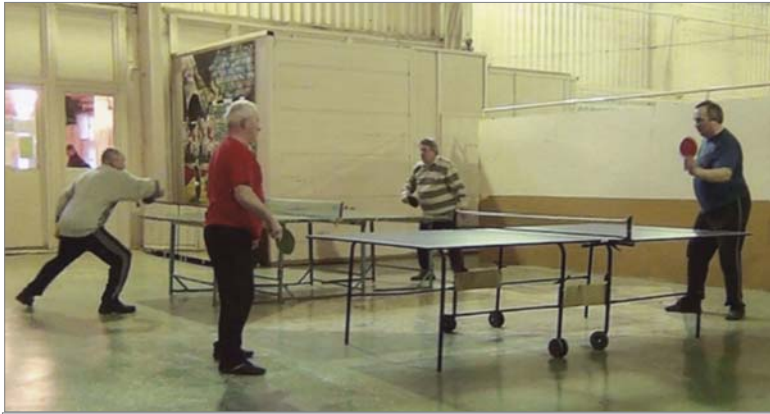
Соревнование по настольному теннису.

Завершилась пятая Спартакиада ветеранов ОАО «ДИНУР».