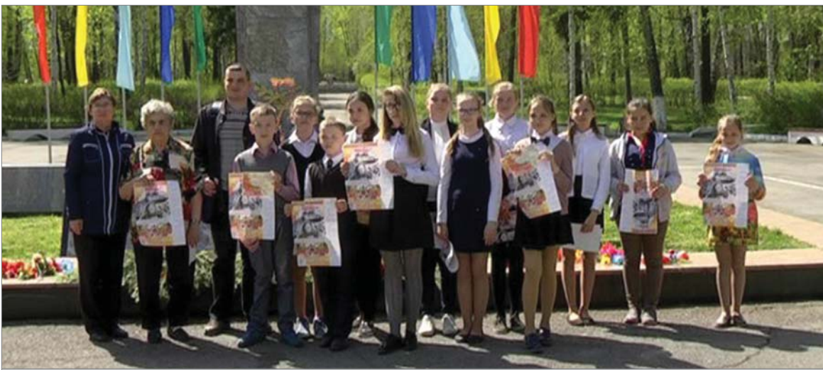
Участники поэтического марафона-2016.

Во вторник у Обелиска Славы звучали стихи о войне и мужестве – здесь состоялось награждение участников поэтического марафона «Подвиг солдата», в преддверии Дня Победы организованного «ТВ-Динур».