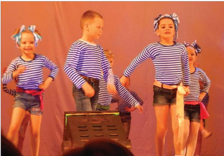
На сцене - самые маленькие артисты «Фиесты».

Пятнадцатого мая участники образцовой студии эстрадно-бального танца «Фиеста» отчитались перед зрителями.