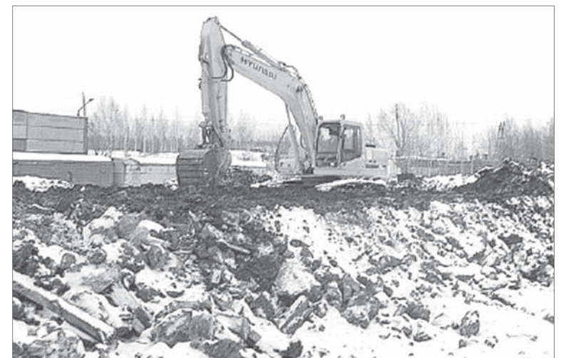
Подготовила Екатерина ТОКАРЕВА

Завершилась проработка проектной документации, подошли к концу согласительные процедуры, были закуплены конструкции - фирма «Базис», её специалисты незадолго до этого сдали склад-пристрой на участке плавящихся материалов цеха №2. Результат труда - складское помещение площадью 36 на 60 метров с железнодорожным тупиком, двумя кран-балками.