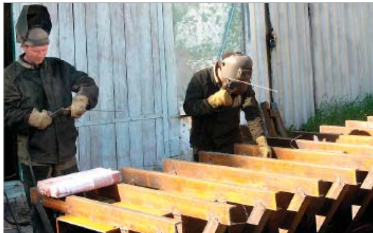
Заводские строители монтируют водоприёмный лоток.

Весь объём теперь перекачивается в заводскую оборотную систему.