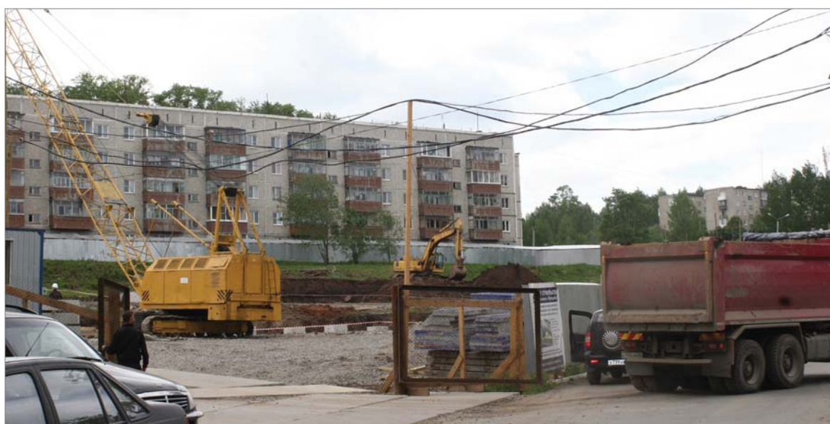
Кран, другая строительная техника — сегодняшние приметы Динаса.

торжественное вручение ключей от уютных квартир работникам завода — счастливым новосёлам.