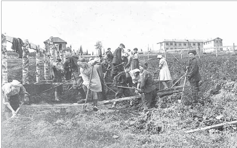
Дворец культуры строили всем миром. Конец 1940-х.