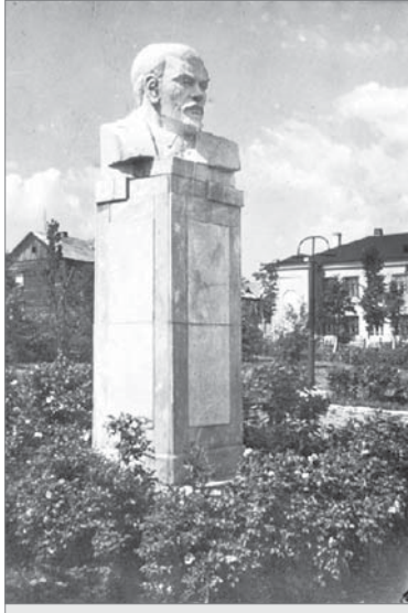
Фото-загадка. В каком уголке Динаса был установлен этот бюст?

Здание управления социального развития недавно сменило цветовую гамму. В семидесятых годах, как видно на фото, опубликованном в предыдущей подборке «Старого Динаса», его фасад украшали