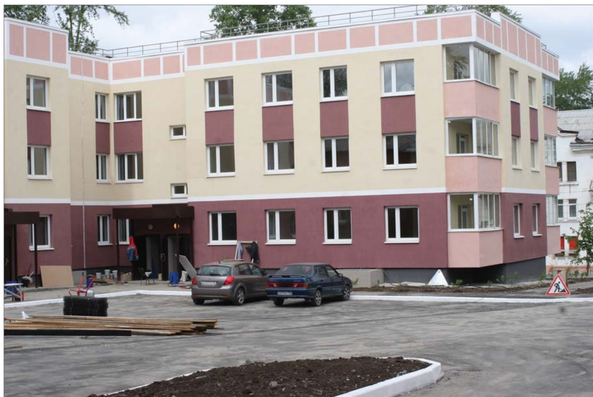
Заводской дом по улице Ильича, 9 готов принять новосёлов.

Динас строится. В жилые массивы вписаны красивые здания детских садов. Семьи обживают квартиры в трёхэтажке, возведённой по программе сноса ветхого и аварийного жилья.