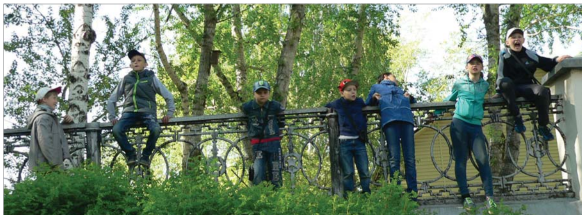
Сверху видно лучше.