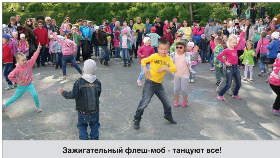
Зажигательный флеш-моб - танцуют все!