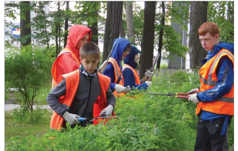
Школьники подрезают кусты на заводской аллее.

Весь июнь на заводе будут работать тридцать старшеклассников пятнадцатой школы.