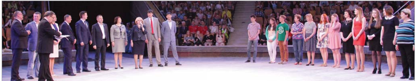
Депутаты ЗакСо награждают победителей творческого конкурса «Камертон».

Ежегодный, уже двенадцатый областной творческий конкурс «Камертон» под патронажем Законодательного Собрания Свердловской области состоялся под девизом «Патриот – это звучит гордо!»