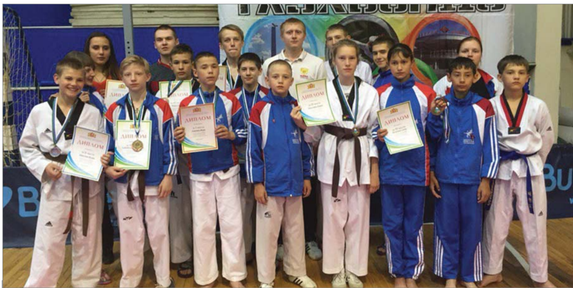
Участники первенства области по тхэквондо (сборная города).