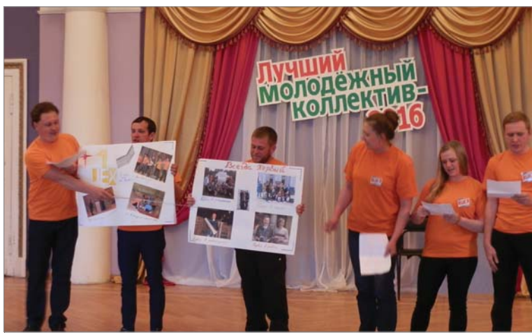
Команда цеха №1 на конкурсе «Лучший молодёжный коллектив».

- Времени на подготовку было мало – две недели, но