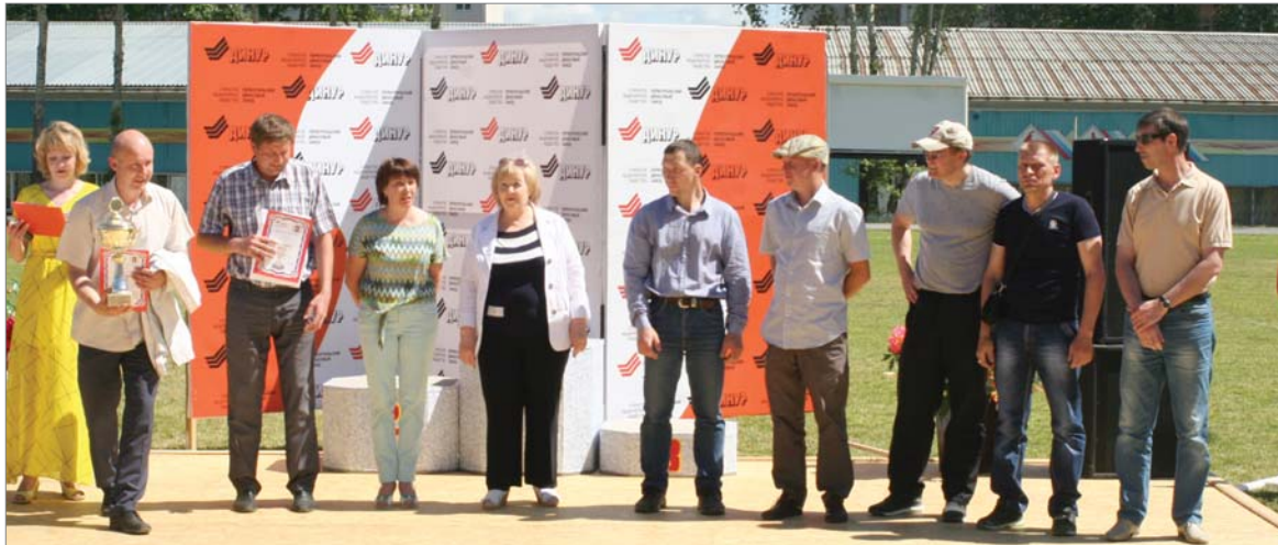
Сборная РСУ и энергоцеха стала победителем.