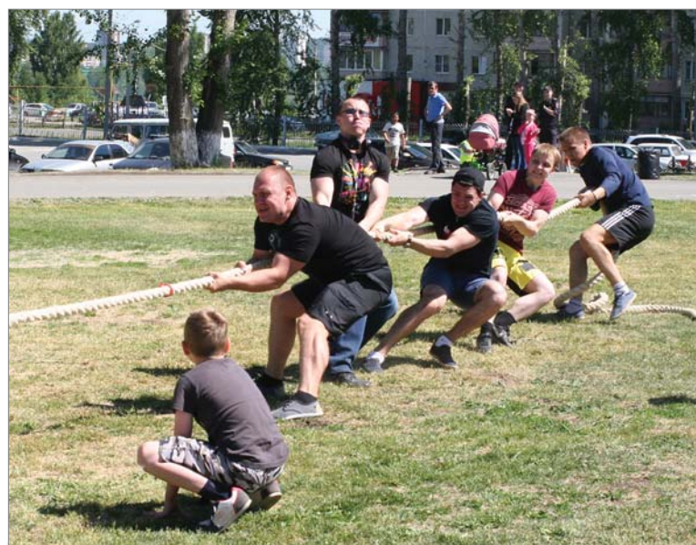
При перетягивании каната эмоции зашкаливали.