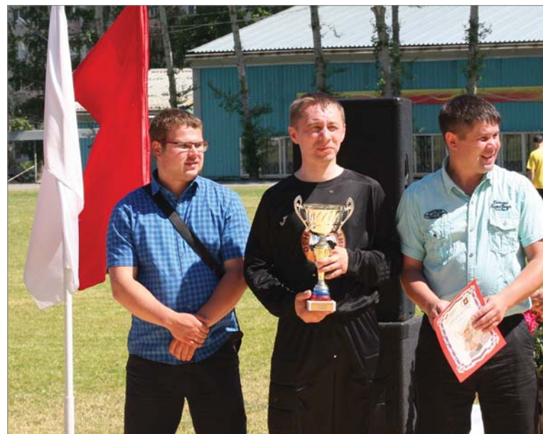
«Золото» Спартакиады руководителей — у МЛЦ.