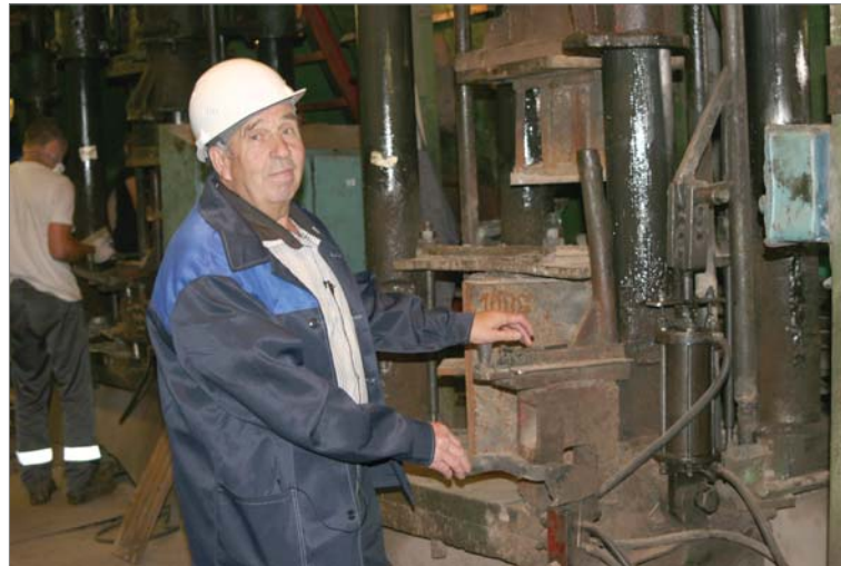
Ветеран и сейчас сформирует простую марку.

казал, где раньше находился склад готовых изделий, «слесарка», обжиговый участок, на котором буквально до 80-х годов прошлого века стояли газокамерные печи.