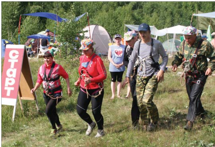
Стартует сборная УСР-ЦЛМ.