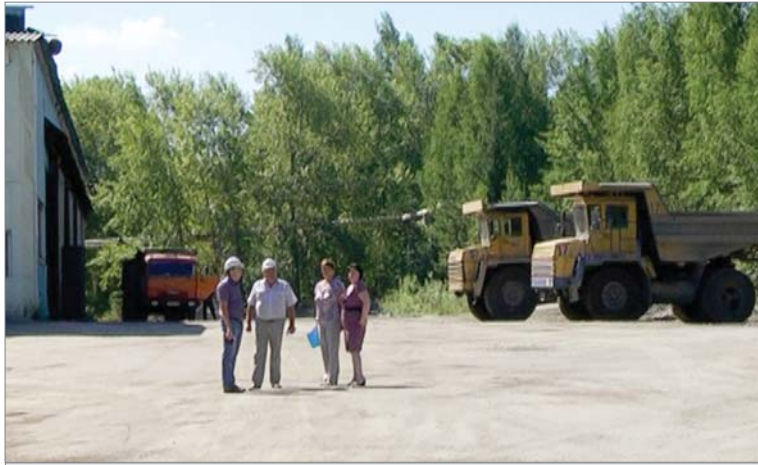
Заводская комиссия у ворот гаражного бокса АТЦ.

Механолитейный цех, например, сделал косметический ремонт санузлов на участке механизации и автоматизации и ремонт отделения обечаек литейно-механического участка. Работники первого цеха разбили цветочные клумбы возле участков УПБМО, УПФО и склада готовой продукции, отремонтировали кабинеты. Цех № 2 представил на конкурс пять объектов, в том числе обустройство зоны отдыха у входа на УКГИ, строительство слесарной мастерской на УПСОП в отделении по производству диоксида циркония, благоустройство площадки после демонтажа прессы на ПФУ. Железнодорожный цех осуществил космети-