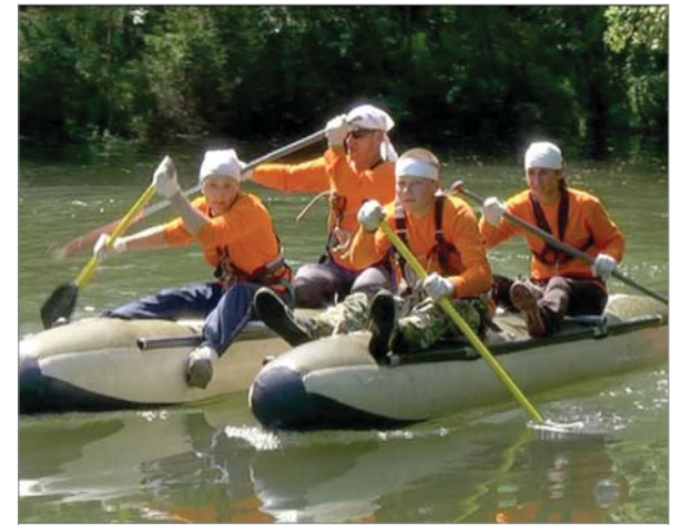
На водной переправе команда цеха №1.

9 июля прошёл заводской турслёт. Как и в прежние годы — интересно, весело, дружно, всё на той же поляне у первого хомутовского моста.