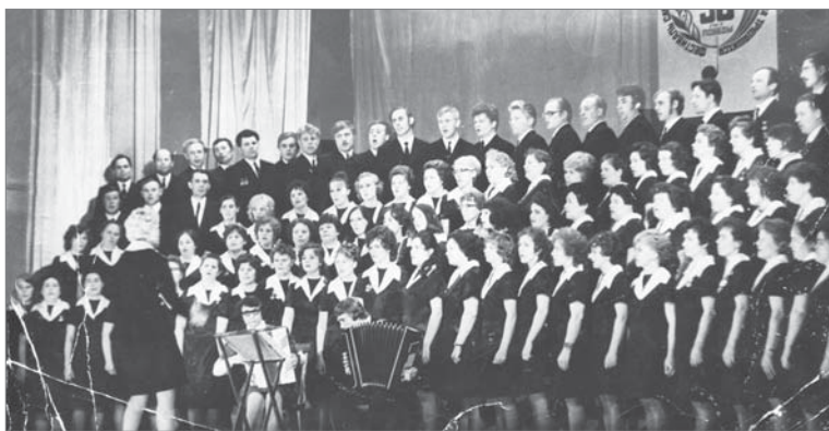
Поют огнеупорщики цеха № 2, 1975 год.