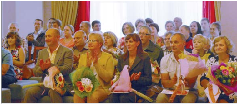
Ветераны труда и передовики после награждения.

В среду состоялось чествование динуровцев, которым присвоено звание «Ветеран труда завода», и тех, чьи портреты размещены на Доске Почёта.