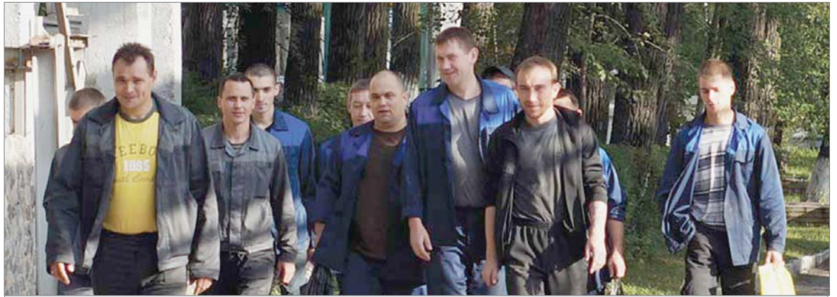
Заводчане торопятся на работу.