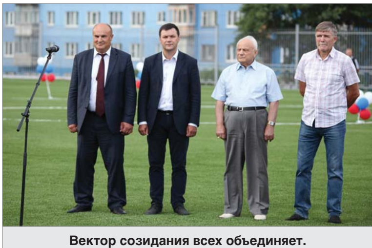
Вектор созидания всех объединяет.

Значимое событие для развития массового спорта в нашем городе состоялось во вторник, 12 июля. На стадионе «Уральский трубник» открыто первое в городе футбольное поле с искусственным покрытием.