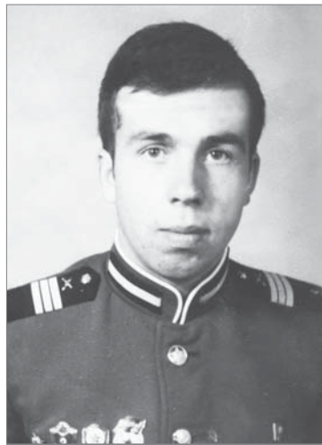
Из армейского альбома, 1970 год.