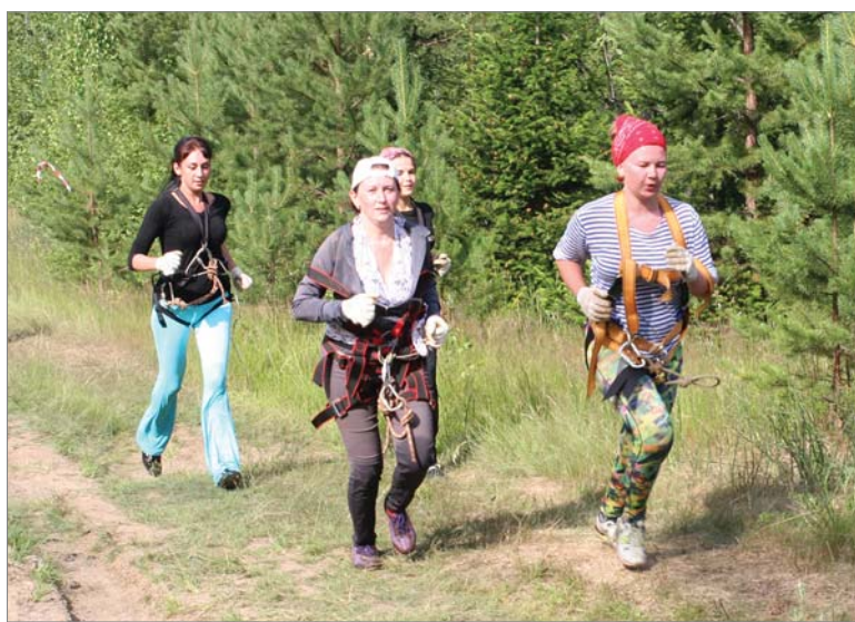
Близок финиш для команды ОТК.

Прохождение маршрута с препятствиями, позво-