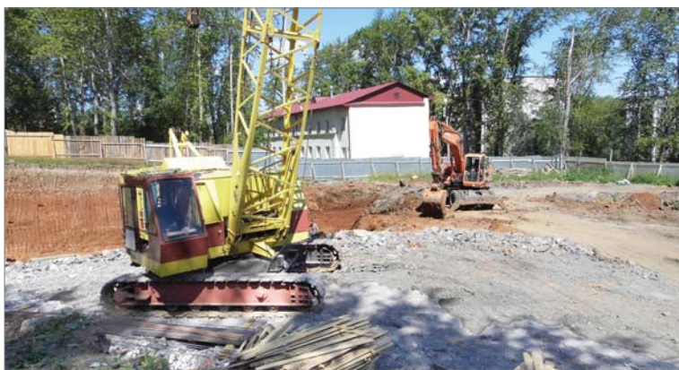
Начато строительство дома для заводчан.

В четверг закончен основной объём по сооружению сцены на заводском стадионе, где пройдёт празднование Дня металлурга. Работники РСУ в двенадцатый раз устанавливают сцену, площадку перед ней, стойки с навесом для защиты от солнечных лучей и дождя, поэтому можно уверенно говорить об опыте и профессионализме. «Если раньше на развёртывание работ уходило четыре дня, сегодня укладываемся в два с половиной».