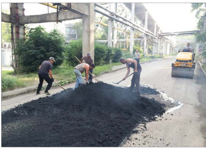
На заводе продолжают приводить в порядок дороги.