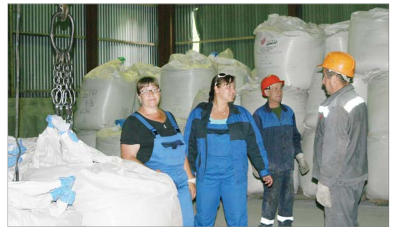
Сотрудники центрального склада освобождают площадку под новый товар.

Сырья на склад приходит много — бокситов для первого цеха, глинозёмов и песка для второго. Металл — для механолитейного цеха и ремонтных работ РСУ. Участки расширяются — приходит новое оборудо-