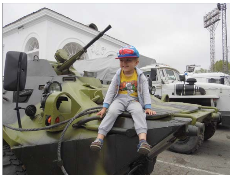
Я тоже буду защищать людей!