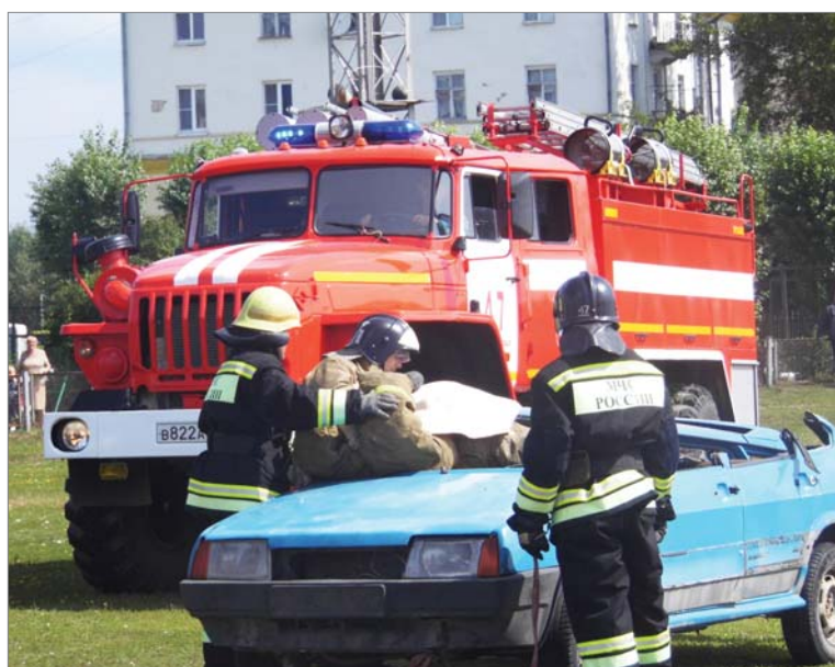
Счёт – на секунды. Специалисты МЧС спасают пострадавшего в аварии водителя.