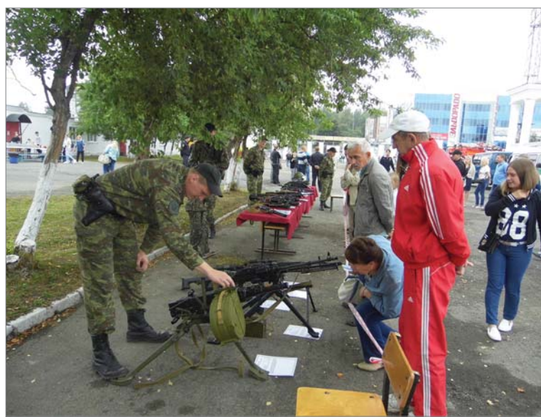
Когда ещё так близко рассмотришь оружие!