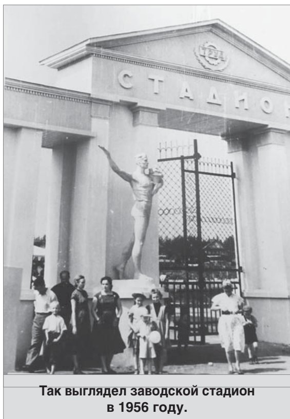
Так выглядел заводской стадион в 1956 году.

Заводскому физкультурному движению в этом году исполнилось восемьдесят лет. У его истоков стояли неравнодушные люди.