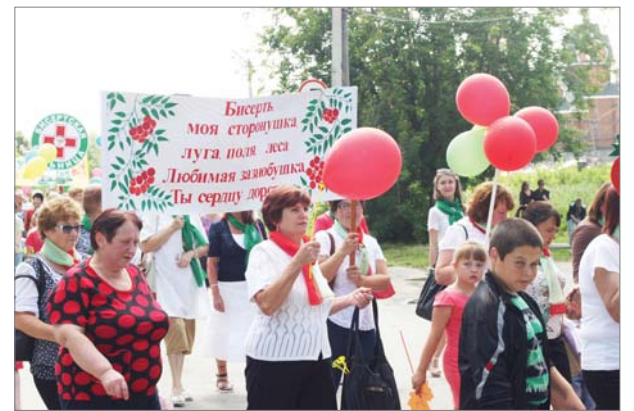
На праздник — от мала до велика.