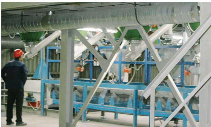
Новая линия дозирования лётчных масс обеспечивает более высокую производительность.