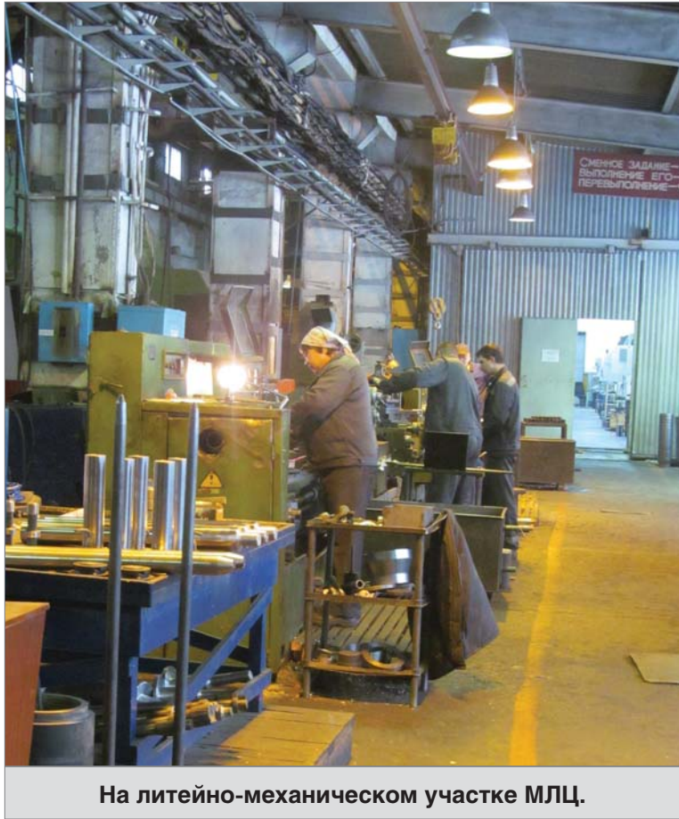
На литейно-механическом участке МЛЦ.

В цех руководством предприятия приобретено много нового оборудования, которое в разы экономичнее старого. Нынче, например, установлены ещё два обрабатывающих центра — фрезерный и токарный. Сделан капитальный ремонт токарно-расточного станка, у которого мы поменяли всё электрооборудование. Экономия даёт светодиодные лампы, которые устанавливаем по мере возможности, и, конечно же, организационно-технические мероприятия. Долго добивался, чтобы работники, уходя на обеденный или технологический перерыв, выключали всё освещение, не забывали об этом и во время перемены. Сегодня с удовлетворением отмечаю, что для большинства такое на-