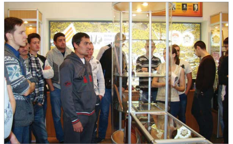
Экскурсия в заводской музей стала частью программы.

— Сегодня «ДИНУР» хоть немного узнал. У меня, как у всех, дорога до раздевалки, цеха, столовой и обратно. Больше нигде не был. О молодёжном совете интересно рассказывали, может, и присоединюсь к их работе.