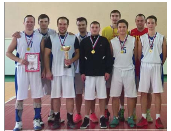
Команда «Динур» — победитель турнира среди мужчин.