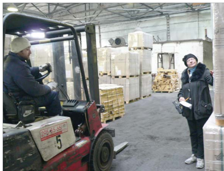
Идёт погрузка воздушнонагревательного динаса.

Погрузчик в это время пронесётся мимо нас, подхватывая «пакеты» по од-