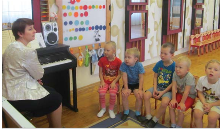
К Дню народного единства ребята из группы «Буратино» разучивают патриотическую песню.