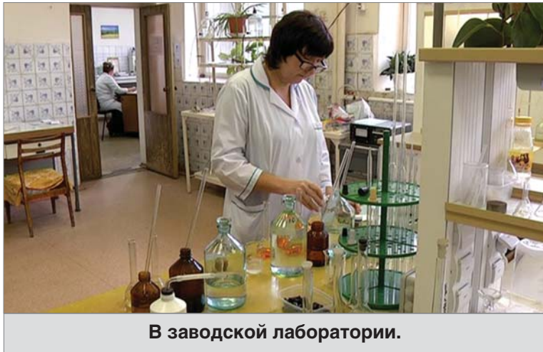
В заводской лаборатории.

- Инспекторы Росаккредитации работали в течение двух дней, 13-14 октября. Их задачей было — проверить нашу компетентность, правильность проведения всех процедур, методов анализов, проводимых в испытательной лаборатории. Напомню, лаборатория была аккредитована в 1993 году. Она периодически должна подтверждать свою компетентность. Росаккредитацией определены критерии, по которым оцениваются работы, выполняемые в лаборатории, и установлена периодичность проверок. Два года назад условия аккредитации были основательно изменены, кардинально изменились и требования к испытательным