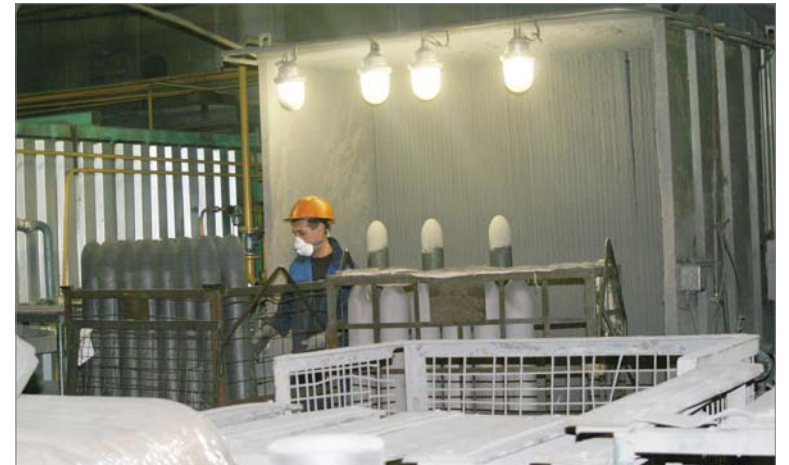
Идёт садка продукции в печь для глазурования.

- Чтобы такие объёмы осилить, на участке выполнили ряд работ, важных для нас как в техническом, так и организационном плане. Приобретены и установлены ещё две колпаковые печи, что позволило закрыть брешь в технологии обжига продукции. Построена вторая печь для глазурования изделий, теперь эта операция не является сдерживающим фактором в технологическом процессе. Важный момент — комплектация коллектива, обучение новичков и, конечно, организация работы в сменах. За три месяца на уча-