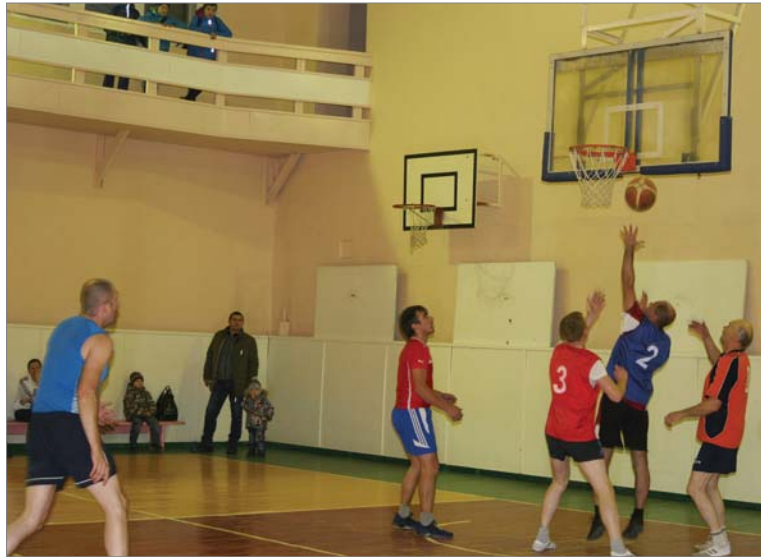
Под кольцом - баскетболисты АТЦ-ЖДЦ и УСР-ЦЛМ.

Соперники лучше подготовлены, они живут спортом, поэтому в физическом и техническом планах мы уступали.