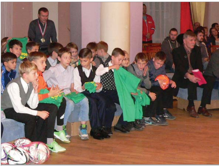
Подарки от обкома ГМПР — юным футболистам.

- Играю центральным полузащитником. Это сложно – нужно подключаться к атаке и возвра-