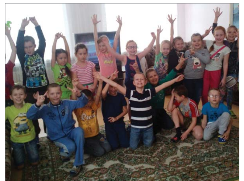
Каникулы в «Сказке» - это здорово!

Впечатлений много, испытали радость, преодолели стеснение. Спортивные мероприятия в бассейне, «Весёлые старты», эстафеты чередуются с музыкальными, театрально-развлекательными, игровыми «У светофора нет каникул», «Там на неведомых дорожках», «Театр теней», «Танцевальный марафон», шоу «Один в один». Несколько раз ребята побывали в кинотеатре «Восход». 6 ноября смена закончится.