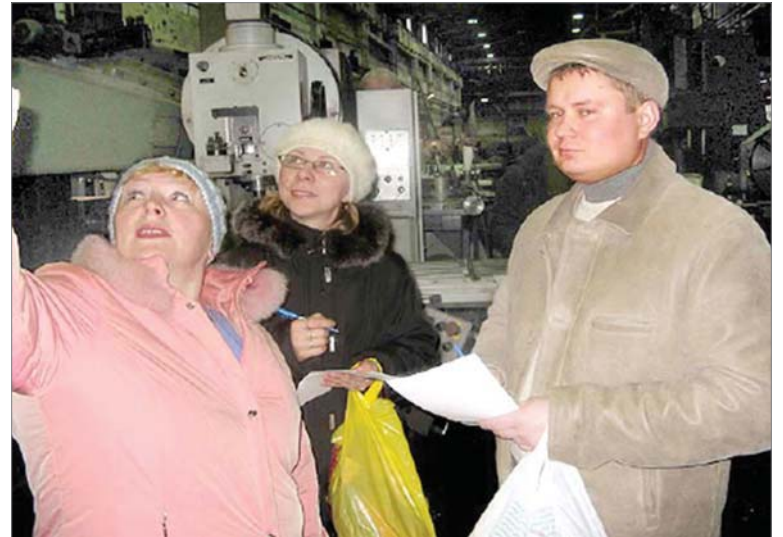
От взгляда конкурсантов ничего не укрылось.

Всем конкурсантам выдали заполненные инструкционные карточки работников, где намерено допущено по пять неточностей. Их требовалось найти и исправить. После участники отправились по цехам для проведения первой ступени контроля по охране труда. Тем мастерам, чей стаж насчитывал менее пяти лет, предложили посетить участок ШПУ-изделий цеха №1, группе более опытных конкурсантов — механический участок МЛЦ.