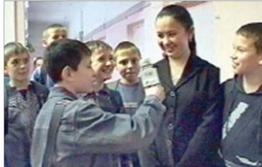
Юнкоры ТВ за работой.

У меня такая служба – быть в курсе событий, мониторить их для руководителей, готовить информацию в корпоративные СМИ и т.д., и т.д. Одним из событий ноября на заводе станет 25-летие «ТВ ДИНУР». Оно старше «Огнеупорщика», ровесник секций баскетбола и тхэквондо, известных НТВ, ОТВ, «4 канала».