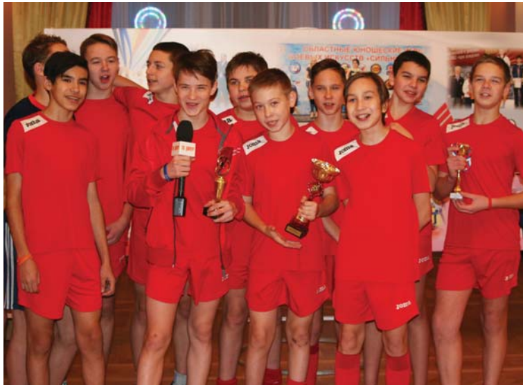
Футбольная команда 2002-2003 года рождения.