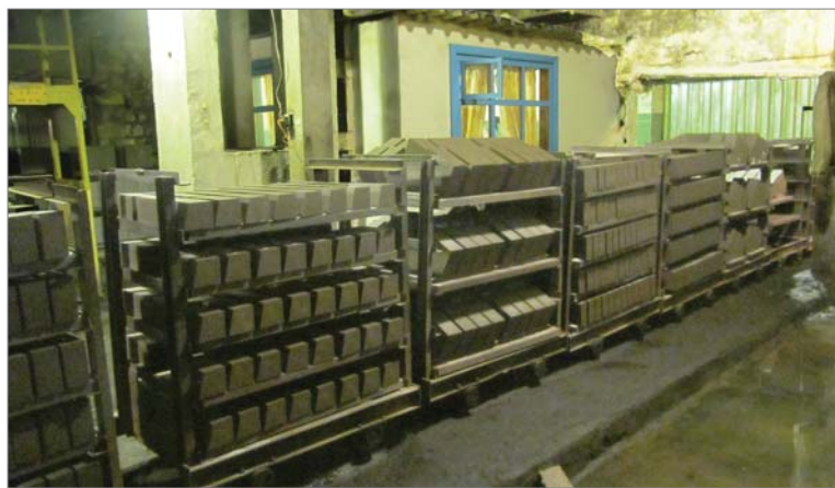
Сформованные огнеупоры отправляются на обжиг.

- Обидно, что нет прежних объемов по ковшевым огнеупорам. Зато серьезно подросли по другой продукции - так называемой дырчатой насадке. Здесь добились хороших результатов, что вполне можно назвать нашей общей победой этого года. Продукция сложная, доставлявшая много проблем. Удалось наладить формовку, начиная с обеспечения более