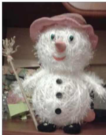
Снеговик из ниток своими руками.