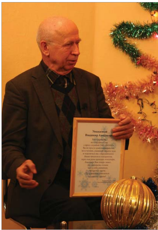
Так талантливый наш предок Нам открыл огнеупор».