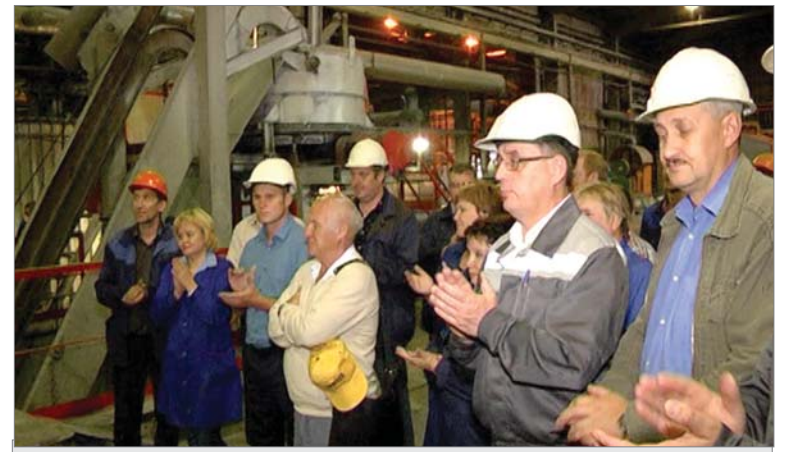
Открытие новой линии дозирования на УПНО цеха №1.

С 11 по 14 июля в Екатеринбурге прошла международная промышленная выставка ИННОПРОМ. Наш завод — постоянный её участник. Ныне в рамках презентации проекта «Единая промышленная карта» состоялось подведение первых итогов реализации областной программы «Уральская инженерная школа», в которой «ДИНУР» принимает активное участие. Руко-