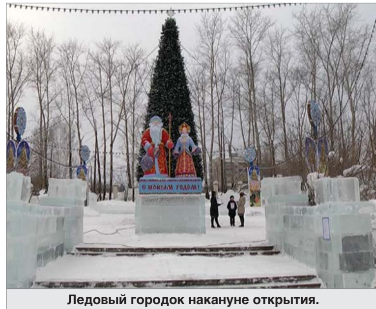
Ледовый городок накануне открытия.