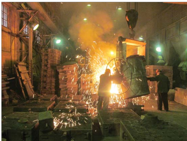
Горячий металл через горнило печи выливается в чайниковый ковш, а затем сталевар и его подручный разливают огненную массу по формам.

Коллектив литейщиков, в котором полтора десятка человек, решает большие задачи. Конечный результат зависит от каждого: формовщика и сталевара, стерженщика и земледела, подручного сталевара и выбивальщика, обрубщика и машиниста крана, транспортировщика и мастера... Работа здесь организована в круглосуточном режиме. План большой и выполнить его — главная задача.