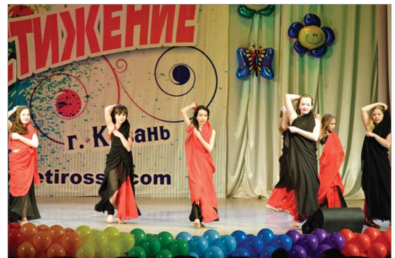
Участницы студии «Хаят» исполняют на конкурсе фольклорные восточные танцы.

В среду на крыльце заводского Дворца культуры дети и взрослые запускали воздушные шары. Родители встречали дочерей, которые занимаются в студии восточного танца «Хаят», вернувшихся с международного конкурса-фестиваля «Достижение» из Казани.