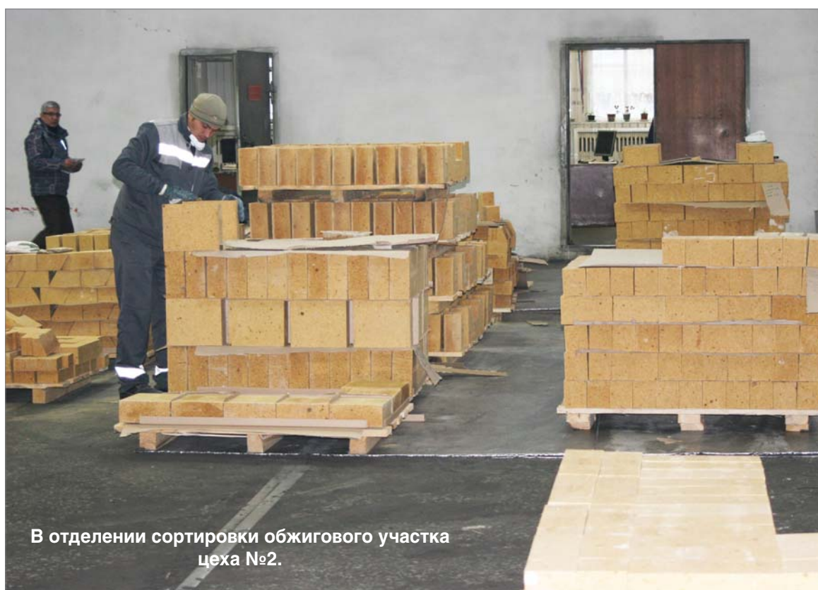
В отделении сортировки обжигового участка цеха №2.

- Технология в нашем цехе, в отличие от перво-