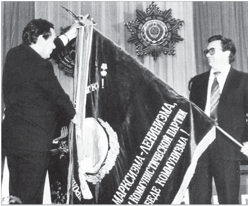
1982 год. Момент вручения заводу ордена Дружбы народов.