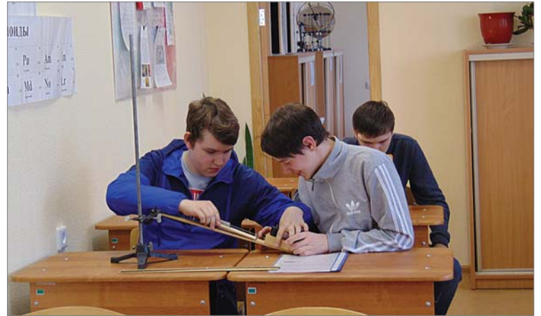
Лабораторная работа по физике у студентов первого курса.

- На мой взгляд правильно, когда молодые люди двигаются постепенно, - считает