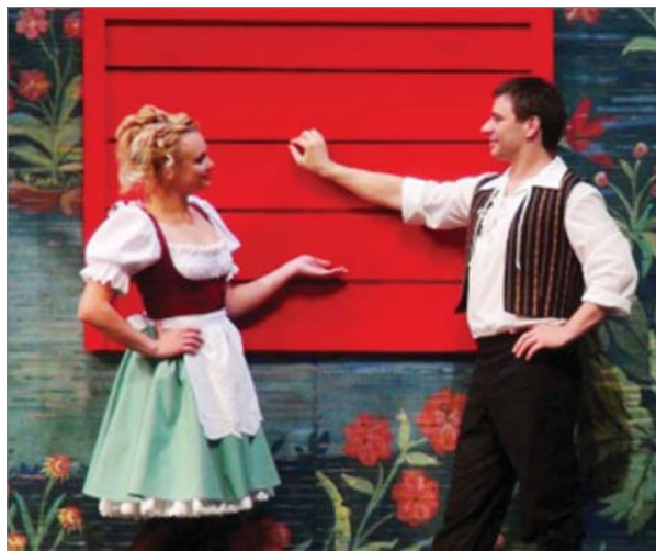
Фрагмент из спектакля «Безумный день, или женитьба Фигаро».

- Года два назад был с ребёнком на детском спектакле в Казахстане, когда был в отпуске. Считаю, что в театр ходить необходимо за новыми впечатлениями.