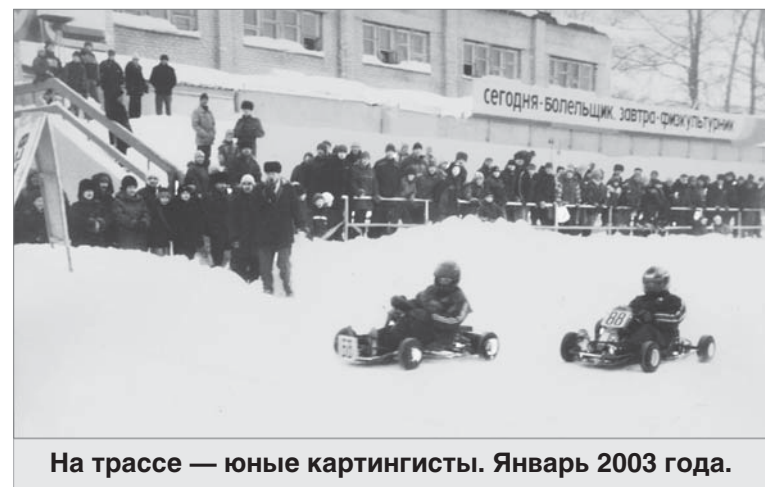
На трассе — юные картингисты. Январь 2003 года.

пожаловали участники другого невиданного для Первоуральска зрелища — областных гонок на полноприводных автомобилях. На старте — отечественные внедорожники: «УАЗы», «Нивы»,