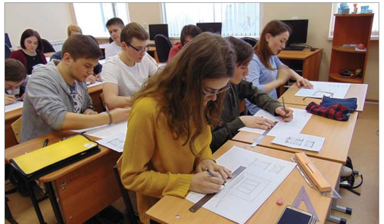
Урок по начертательной геометрии в группе архитекторов.

она, - начинают с колледжа, где есть возможность ближе познакомиться с производством, а потом получают высшее образование, которое даёт больше теоретических основ профессии.