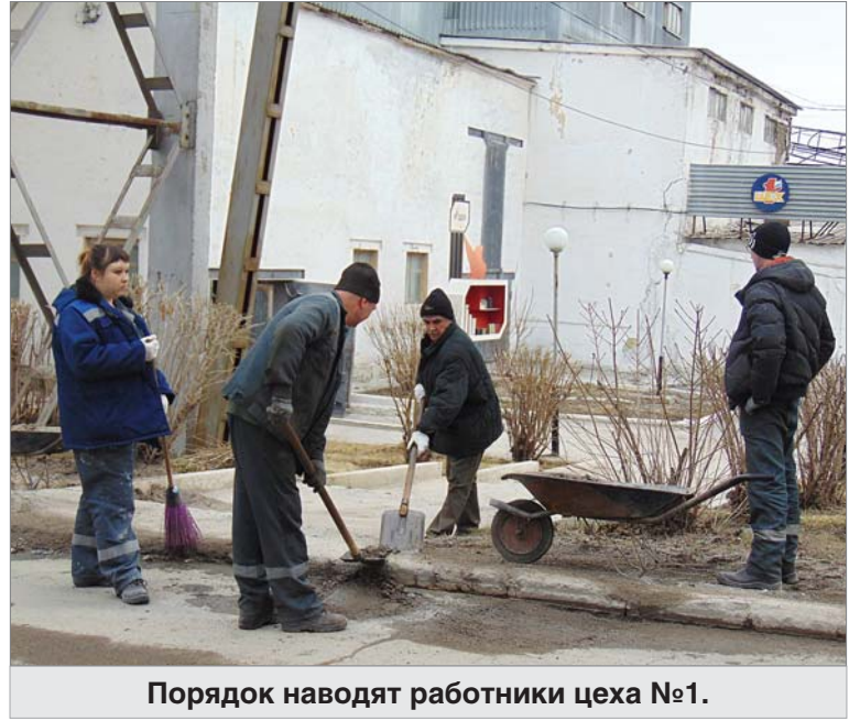
Порядок наводят работники цеха №1.

В числе первых, как только сошёл большой снег, динуровцы приступили к генеральной уборке территории предприятия. Чистят дороги, пешеходные зоны, убирают старую листву. Для каждого цеха подробно расписан объём работ, которые необходимо выполнить в период генеральной уборки. Рудничанам, например, предстоит навести порядок на площадке отгрузки кварцита, очистить от веток газон полубункерного склада, упорядочить складирование запасных деталей на открытых площадках участка дробления, сортировки и обогащения... Строителям — упорядочить хранение пиломатериала, поддонов, восстановить нарушенное ограждение