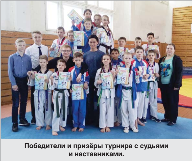
Победители и призёры турнира с судьями и наставниками.