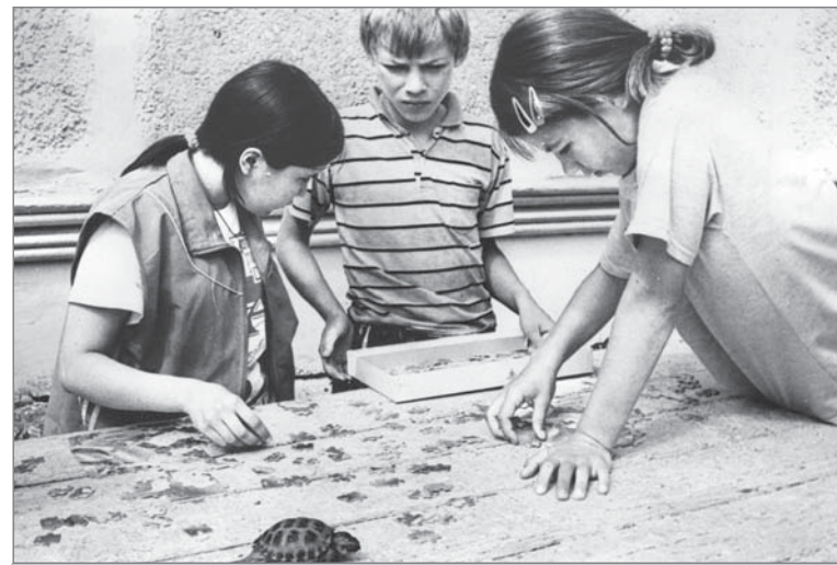
2001 год. В лагере имени Г. Титова.

К истории обращалась Екатерина ТОКАРЕВА