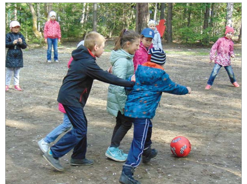
У «Лучиков» футбол по своим правилам.

- В этом году много взрослых ребят, - уточнила она. - Они активные, везде участвуют, настроение у всех хорошее, довольные, весёлые. Малыши могут и поплакать иногда, это нормально - многие из них приехали впервые. На отрядах работают опытные педагоги из 15-й, 5-й школ, два преподавателя музыкальной школы. На первую смену заехали 96 детей, у которых есть возможность и отдохнуть, и подлечиться.