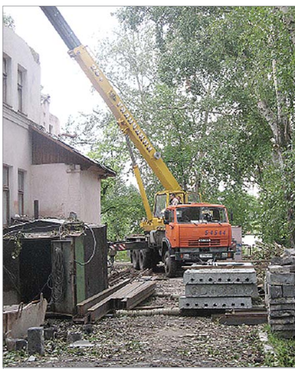
Июнь 2007 года. Ведётся реконструкция здания по улице Свердлова под общежитие.