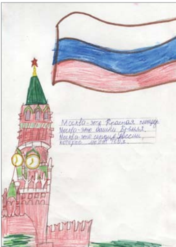
Света Прискалова, 3 отряд.