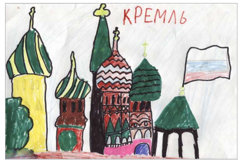
Ренат Рахимов, 3 отряд.