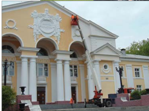
Обновляется фасад ДК «Огнеупорщик».

– Кронирование тополей уже закончено? Траву косите?