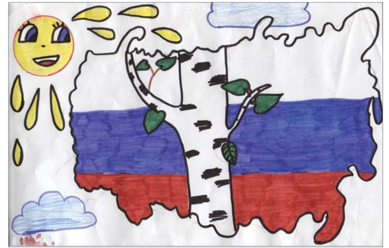
Полина Лузина, 2 отряд.