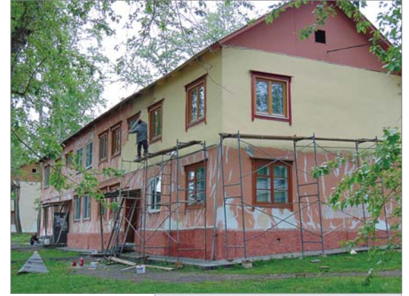
Качество работ – на контроле ежедневно.

– В прошлом году кронировали одну сторону вдоль улицы Ильича, весной этого года – другую. Покос травы – ежегодная проблема, заключающаяся в отсутствии кадров. Не каждый может пользоваться газонокосил-