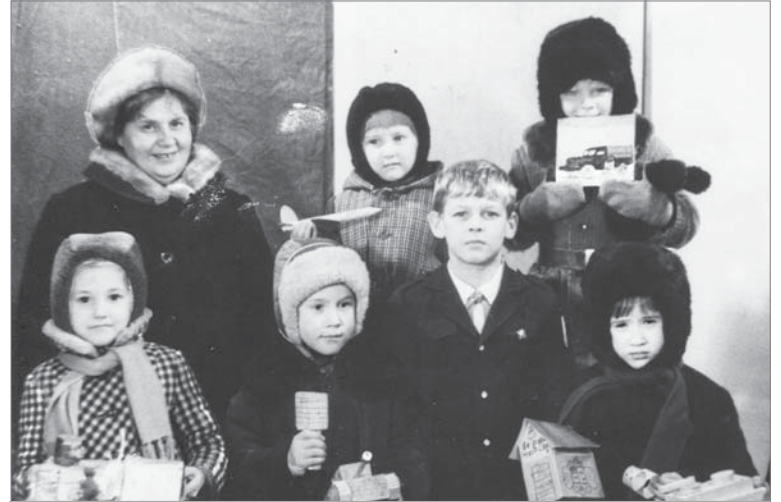
С воспитанниками на экскурсии в помещении бывшего архива завода. Конец 70-х.

Мама меня выучила, я закончила школу и библиотечный техникум. Но судьба повела по другой стезе. В 19 лет я стала воспитателем в детских яслях №2, потом в 15-м детсаду работала воспитателем и заведующей.