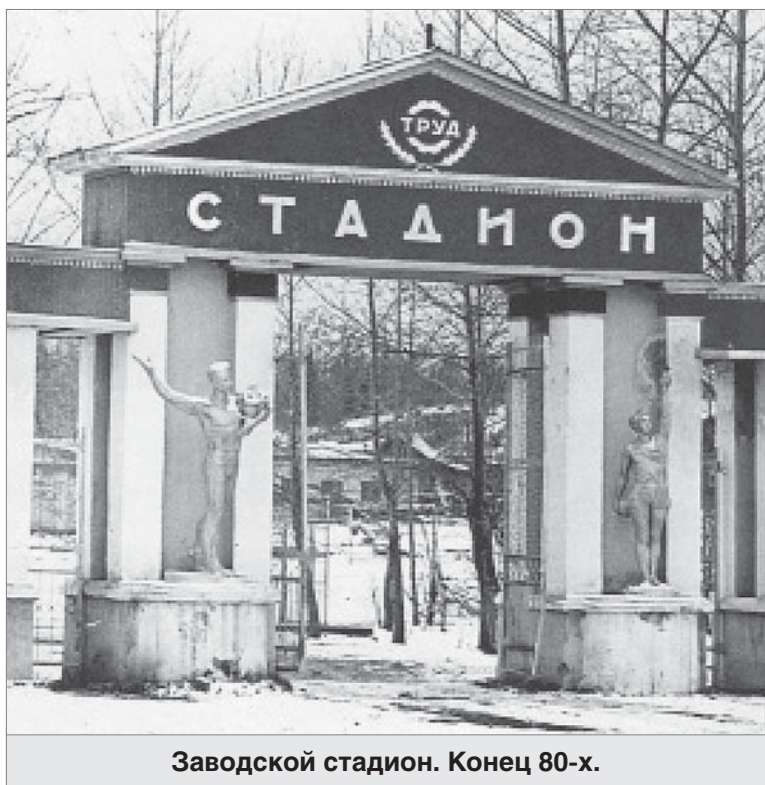
Заводской стадион. Конец 80-х.