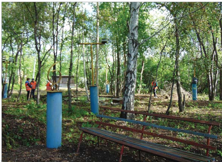
Школьники помогают в восстановлении парка.