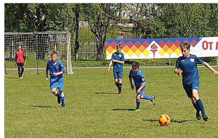
Первая игра «Динура-1» со «Стартом-2004-2».