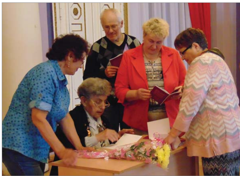
Автограф-сессия — в разгаре.