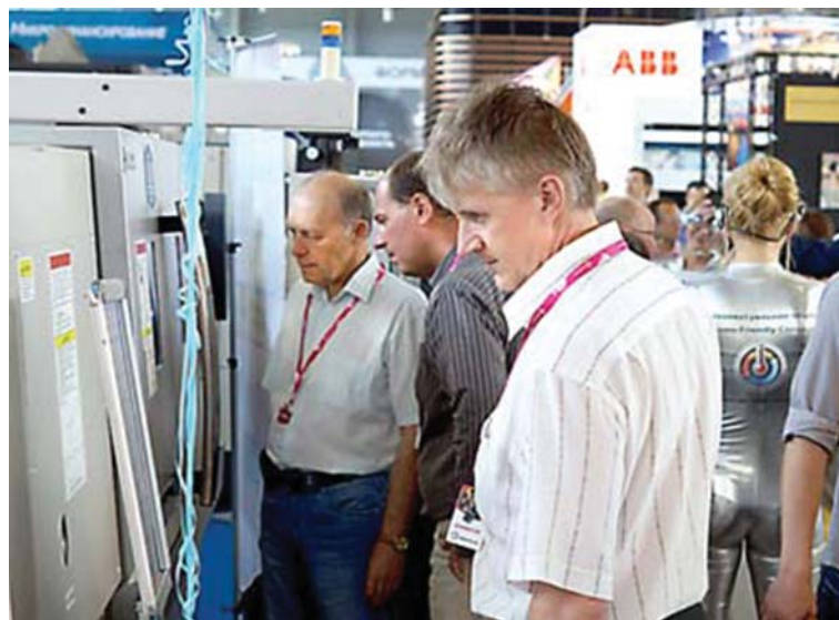
Делегация «ДИНУРА» изучает продукцию на «ИННОПРОМЕ-2013».

Двадцать лет минуло с того июля, когда на Динасе встречались 69 представителей от 26 предприятий России и зарубежья. 7-10 июля 1997-го в заводском Дворце культуры прошла научно-техническая конференция «Огнеупоры и огнеупорные материалы АО «Динур» для металлургического производства». Сейчас, в пору «ИННОПРОМА» и «Экспо», подобным мероприятием не удивишь, но, если вспомнить, какой была ситуация в стране, в промышленности в конце девяностых, то организация встречи коллег внушает особое уважение. Ефим Моисеевич Гришпун, тогда генеральный директор предприятия, сказал: «От-