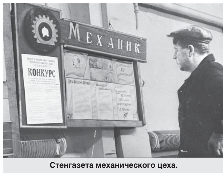
Стенгазета механического цеха.