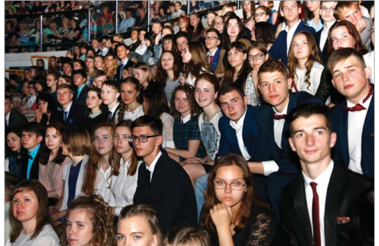
Отличники-выпускники школ Свердловской области принимают поздравления.