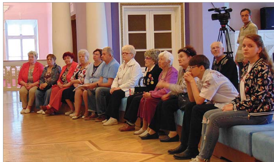
В кругу единомышленников.