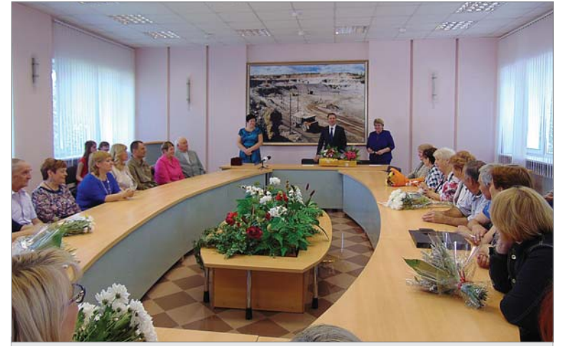
Внимание и цветы — золотым юбилярам.

ловна посоветовала женщинам не пытаться перевоспитывать мужей: «Мужчина пришёл таким, какой есть. Надо просто «подмазать», «подлизнуться», приказывать нельзя. И почаще