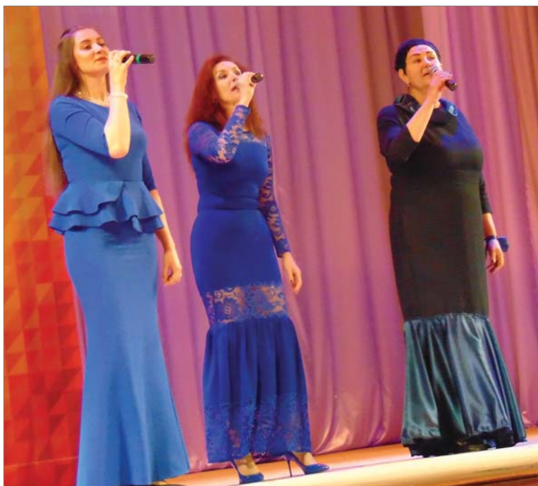
Творческий подарок — песня «Дано мне судьбою».

Екатерина ТОКАРЕВА и Жанна БУТРИМОВА