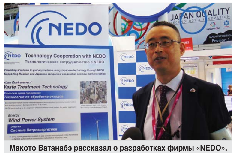
Макото Ватанабэ рассказал о разработках фирмы «NEDO».

Себя показать — одно, важно увидеть, что предлагают другие. Заводские инженеры бывали на вы-