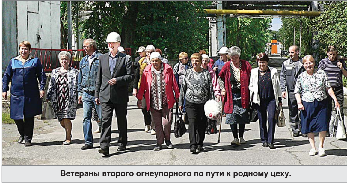
Ветераны второго огнеупорного по пути к родному цеху.

Уже за пределами цеха она рассказала, что начинала работать в четвёртом переделе садчиком. Потом перешла в третий, на прессы. На пенсию ушла с крана 25 лет назад. И продолжила о работе: «Делали много. Сначала не получалось, потом с нормой стали справляться, привыкли. Много «гитары» формовали. Того пресса уже нет, на котором мы делали стеклодины. Вижу, в цехе поливочный режим соблюдают. И мы всегда поливали, на