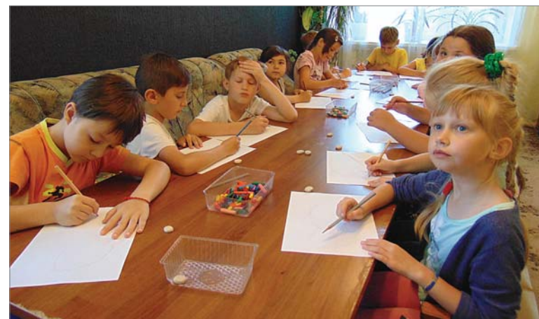
Панцирь, голова, лапы..., получилась морская черепаха.

Пробежав по этажам санатория, скучающих детей я не встретила. Да и сама с удовольствием окунулась в атмосферу детского шумного отдыха, насыщенного играми и интересными за-