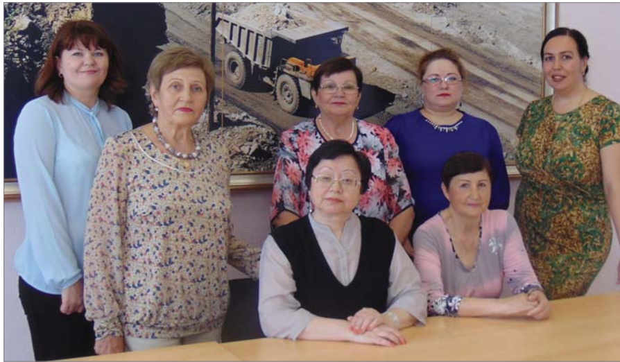
Ветераны службы экономического анализа и прогнозирования и отдела технического контроля пришли в родные коллективы.

Одиннадцать сотрудников бухгалтерии, ушедшие на заслуженный отдых в разное время, встретились в зале столовой №25. Как отметила главный бух-