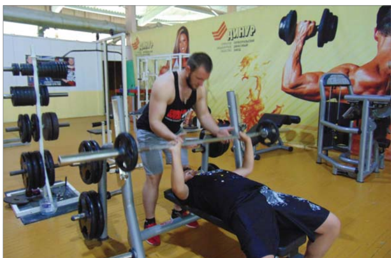
Инструктор силового зала за работой.