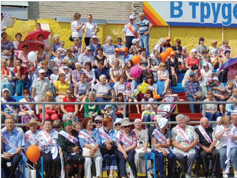
На трибунах свободных мест не было.