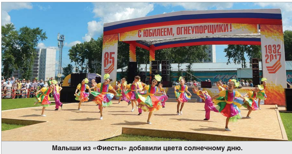
Малыши из «Фиесты» добавили цвета солнечному дню.

Репортаж с Дня металлурга вели Алла ПОТАПОВА, Жанна БУТРИМОВА и Екатерина ТОКАРЕВА