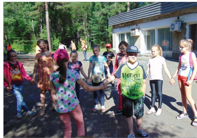
Игра по мотивам песни «Во поле берёза стояла».