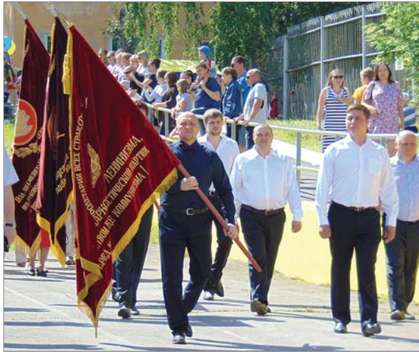
Впереди колонны – знаменная группа.