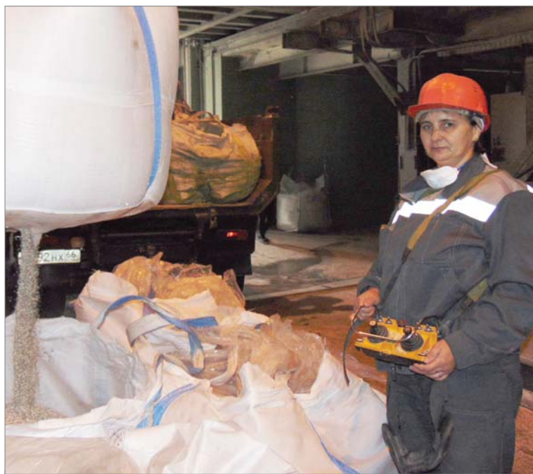
Машинист крана Зилара Фаузетдинова дозирует боксит для загрузки шаровой мельницы.

Жанна БУТРИМОВА