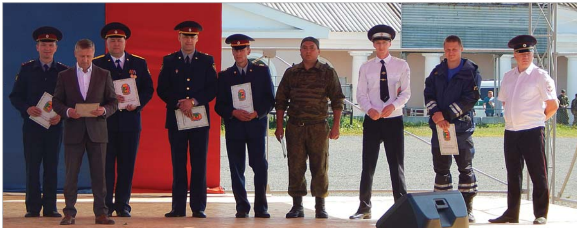
Среди награждённых – сотрудники разных силовых структур.

19 августа на стадионе «Уральский трубник» состоялся праздник работников силовых структур «Служба — дни и ночи».