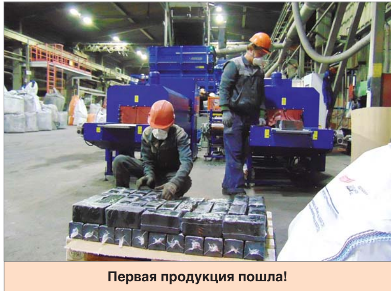
Первая продукция пошла!

В тесном контакте с чешскими специалистами работали наши инженеры лаборатории автоматизиро-