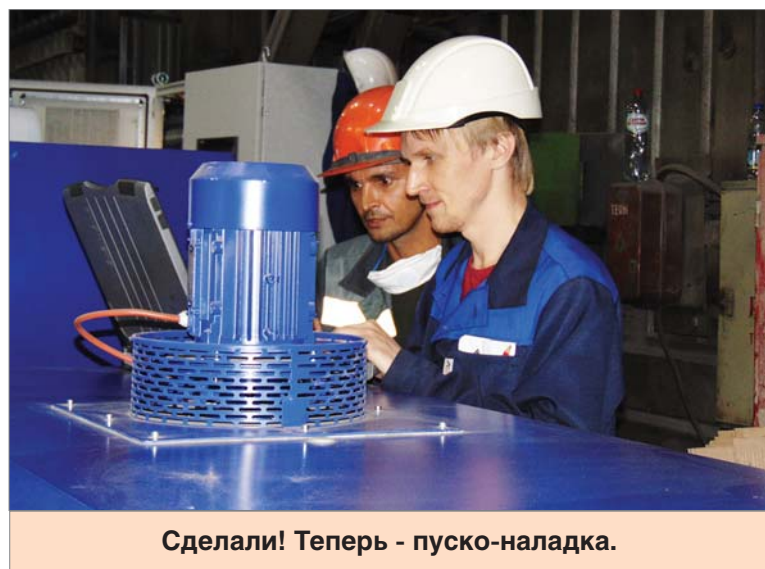
Сделали! Теперь - пуско-наладка.

– Нам нужно будет для каждого комбината подо-