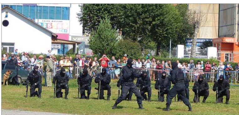
Показательные выступления спецназовцев из Екатеринбурга.