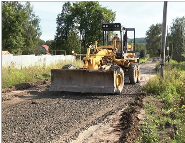
Поддержка «ДИНУРА» не на словах, а на деле.

«Я никогда ещё не избирался представителем земляков в органы власти, поэтому всё внимательно слушаю, записываю. Обещаний не даю. То, на чём заостряют внимание избиратели — это не прихоти, не капризы, а понятное желание ходить по асфальтированным доро-