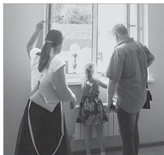
Матвиевские оценивают вид из окна.

Екатерина ТОКАРЕВА