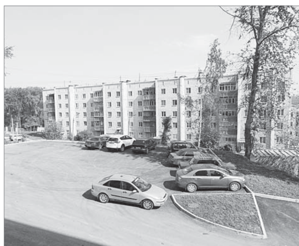
На парковке места хватает.