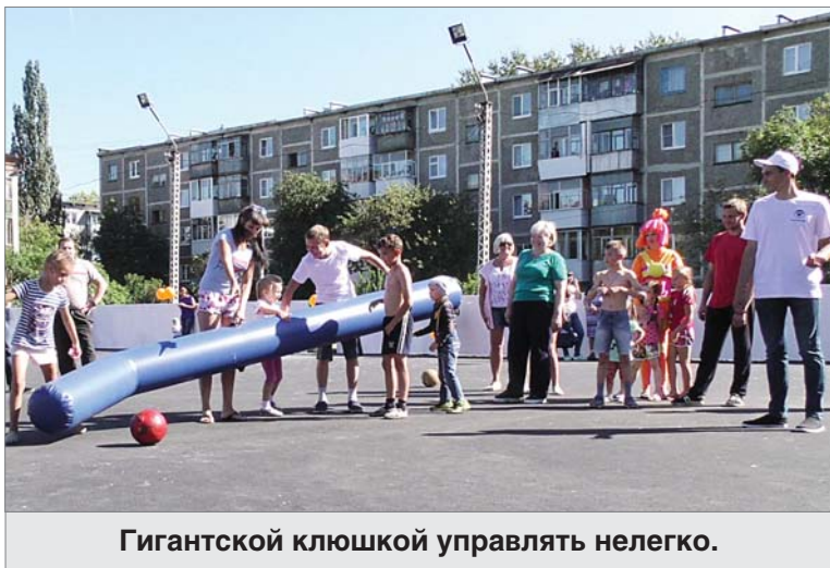
Гигантской клюшкой управлять нелегко.

Идея основательно обновить «коробку» родилась после того, как, откликаясь на просьбу се-