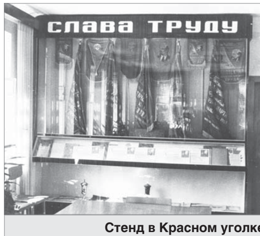
Стенд в Красном уголке РСУ, прежний и современный.