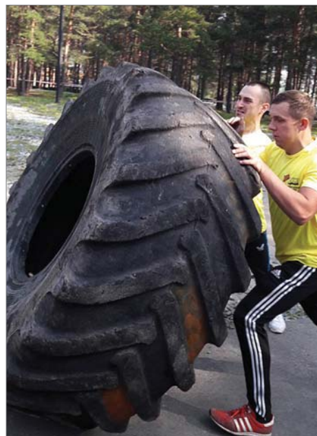
Испытал себя в «Гонке героев», парк Новой культуры, 27 августа.

И мы, первоуральцы, сами не будем ждать чуда, надеяться на «авось» и ждать, когда кто-нибудь за нас уберёт камень с дороги, отремонтирует покосившуюся скамейку, а включимся в обустройство своего двора, своей улицы, клумбы у подъезда, чтобы в будущем с удовлетворением рассказывать своим детям и внукам о том, как делали лучше мир вокруг себя.