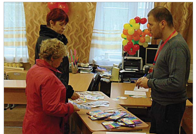
Шанс выиграть в лотерею был у каждого.

Держа коробку с фломастерами, молодая женщина с улыбкой сказала, что выборы для неё всегда были праздничным днём. А проведённая нынче благотворительная лотерея добавила ему приятной интриги.