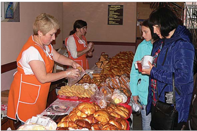
Ах, какие пирожки!

То, что выборы – праздник, особенно чувствовалось у заводского ДК. Проголосовав на разных участках, динасовцы спешили сюда на осеннюю ярмарку. Одни приобретали садовые культуры, выращенные в питомнике «Сказочный сад», другие отдавали предпочтение горшечным цветам заводской оранжереи, большим спросом пользовались продукты сельхозкооперативов «Битимский» и «Первоуральский», продаваемые без торговой наценки. Многие с интересом разглядывали необычные экспонаты выставки «Садово-огородные чудеса», которую традиционно оформили динасовские садоводы. В зале Дворца состоялся концерт творческих коллективов.