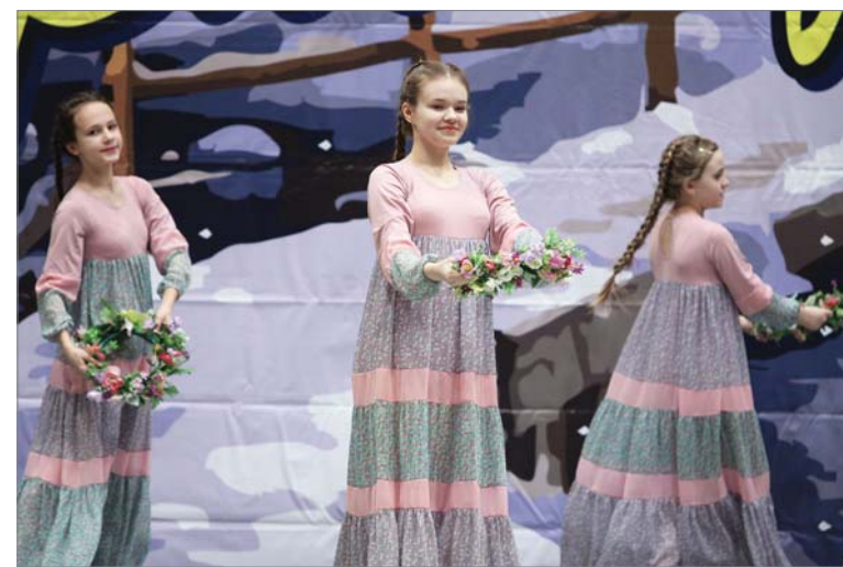
На отчётном концерте – 2017.

таллурга со своим номером. Второй сезон готовлю команду медиков горбольницы №1 к участию в «Танцующем Первоуральске». Исполняли два номера: «Ритмы Кавказа» и «Гопацуйки по-гоголевски». Одной партнёрши не хватило, пришлось самой встать в пару. В компании танцевать не страшно.