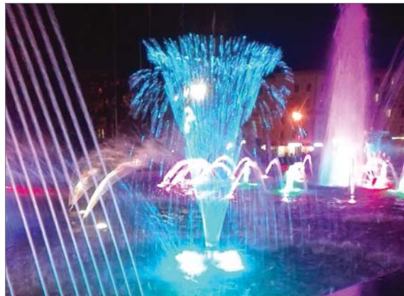
Рисунок фонтана постоянно меняется: то вода струится с краёв в центр, то струи кружатся, то распускаются павлиньим хвостом. Вода может подниматься на высоту 38 метров! Во всей красе фонтан предстаёт в тёмное время суток. Ежедневно в 20-00 он начинает переливаться разными цветами и «танцевать» под музыку. Представление, которое с удовольствием смотрят горожане,

длится 30 минут. Пока на улице температура не опустится до +3 градусов и ниже, фонтан будет работать.