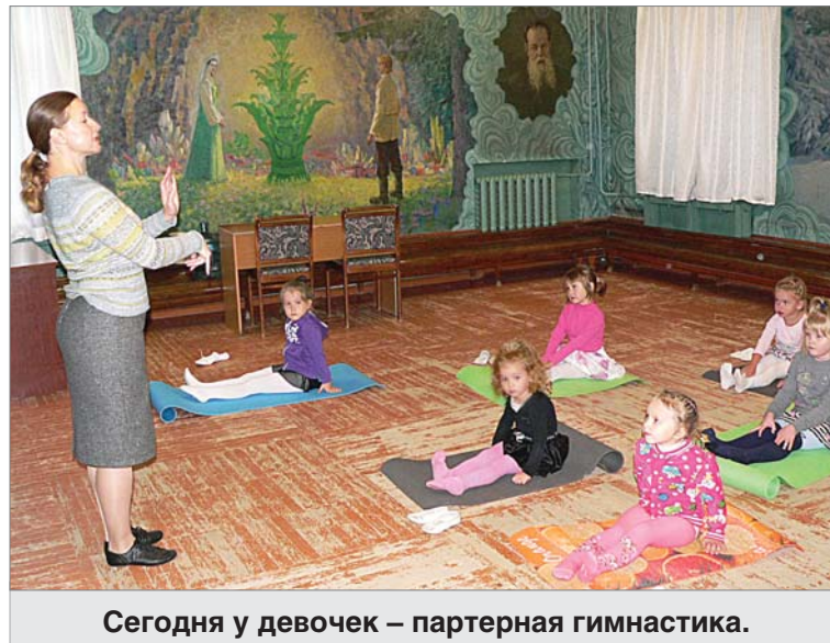
Сегодня у девочек – партерная гимнастика.

– Чтобы дети шли на занятия с удовольствием – это главная цель. Приходят снова и снова, значит им нравится. Кто-то