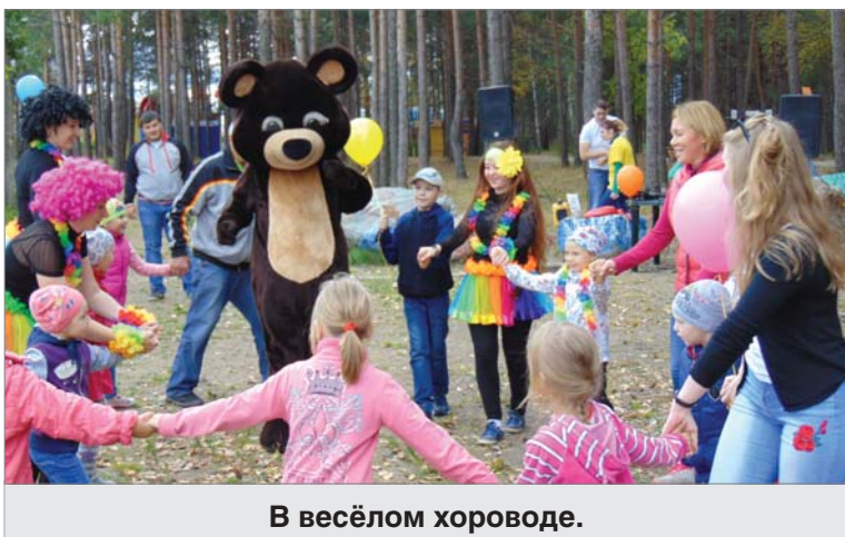
В весёлом хороводе.