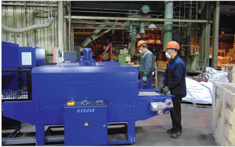
На новой линии по производству лёточных масс.

Несколько лет назад цифры, которые сегодня на-