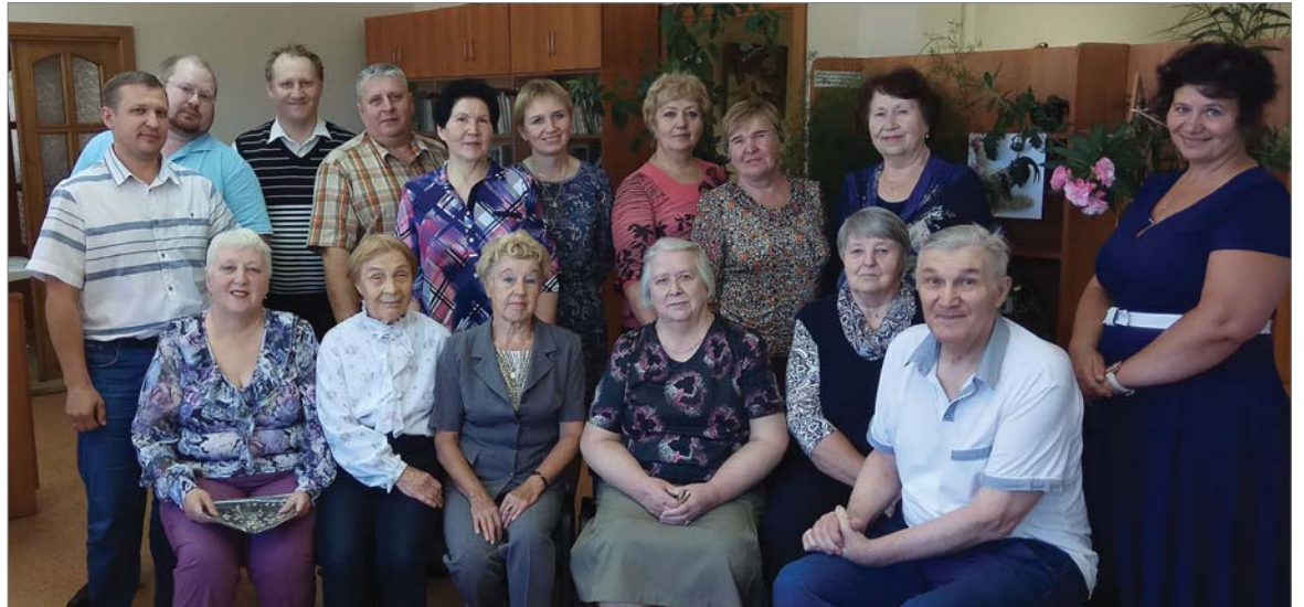
Перед нынешним юбилейным для завода Днём металлурга в ПКО состоялась встреча нескольких поколений конструкторов.

На смену кульманам приходили компьютеры, менялись работники, его руководители, но неизменным оставалось главное предназначение отдела. «ДИНУР» продолжает развиваться: строит новые участки, меняет старое оборудование на современное, более эффективное. Огнеупорное производство сегодня невозможно представить без автоматизированных дозирочных линий, мощных смесителей, высокотемпературных тепловых агрегатов, без участков, где выпускают корундографитовые изделия, товарные порошки, где плавят корунд и диоксид циркония... Всё