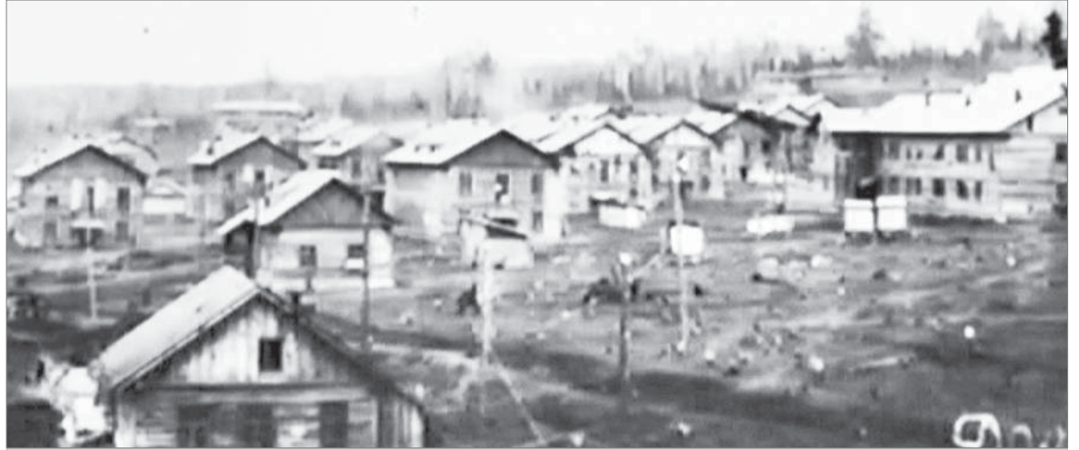
К февралю 1930 года на Динасе были построены первые деревянные дома по улице Кирова.

Параллельно с улицей Кирова строилась и улица Дзержинского. На ней возвели всего 8 домов. История дома под первым номером — самая интересная. В 1931 году в одной из комнат