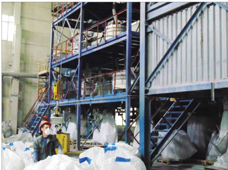
По количеству полных мягких контейнеров можно судить о большом спросе на товарные порошки.

Есть здесь и нерешённые вопросы. Один из них — накопившиеся невостребованные фракции. Что с ними делать? Есть предложение отправлять такое зерно в переплавку. Лоскутов считает: «Надо научиться его рассеивать, потому что в плане экономики это более эффективно». Возможно, очередные эксперименты будут связаны именно с этим направлением.