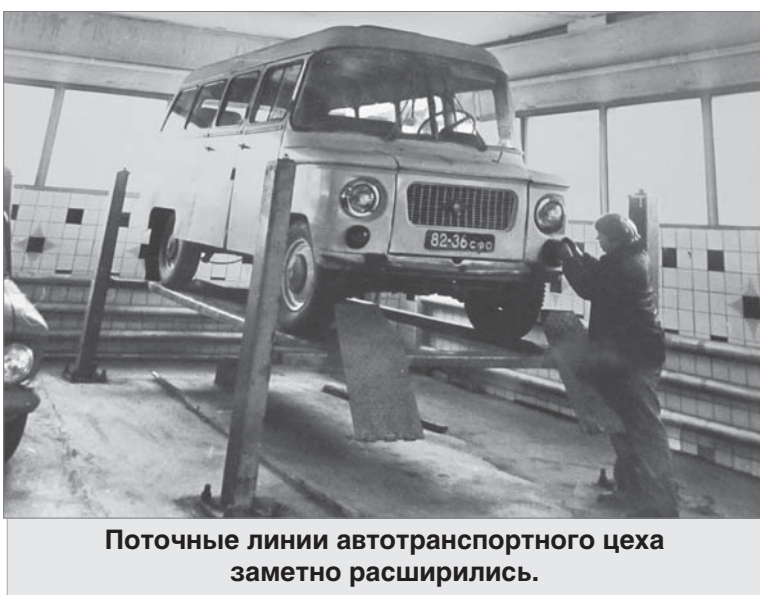
Поточные линии автотранспортного цеха заметно расширились.

Ниже перечислены мероприятия по внедрению новой техники и передовой технологии, средств механизации, улучшению работы аспирационных систем, эстетики производства. «Установлен автоматический съёмник сырца с револьверного пресса №8 в цехе №2, механизирована