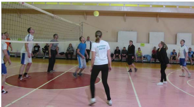
Партию разыгрывают команды цеха №2 и заводоуправления.

В основной группе без поражений до последнего тура шли команды цеха №2 и первый состав волейболистов заводоуправления. В заключительный день соревнований лидеры выясняли, кто же займёт первое место в турнирной таблице. Игра получилась напряжённой: первая партия закончилась в пользу физкультурников заводоуправления, вторая – осталась за цехом №2. И только в третьей определился победитель. С перевесом в два очка этот