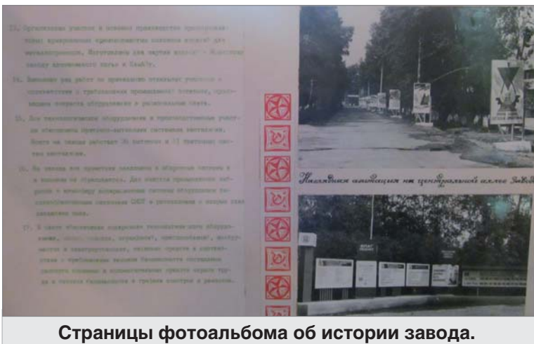
Страницы фотоальбома об истории завода.