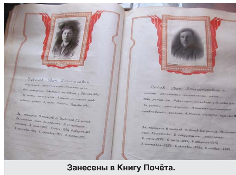
Занесены в Книгу Почёта.