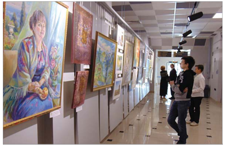
На выставке к 40-летию художественной школы есть что посмотреть. Первые посетители не стали ждать официального открытия.

– Здесь собраны работы преподавателей и выпуск-