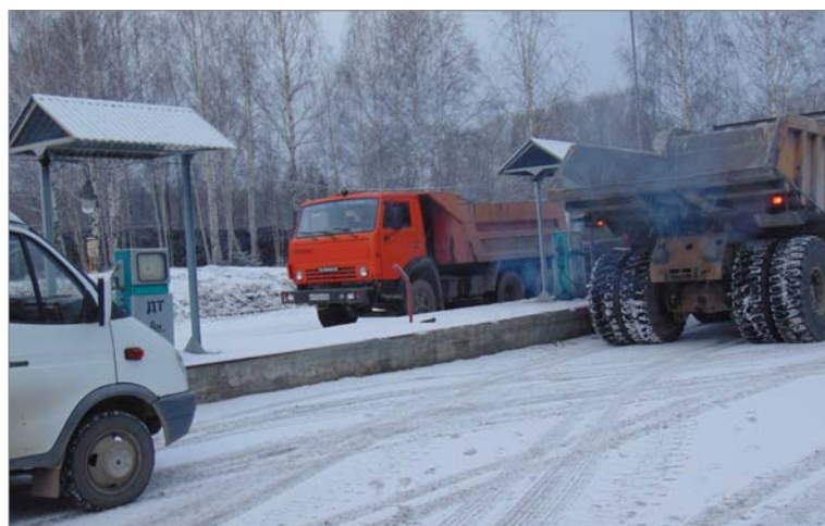
На заводской автозаправочной станции.

«БелАЗа». Лариса Павловна сказала, что на заправку этого гиганта требуется 200 литров.