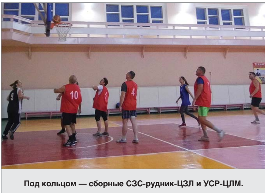
Под кольцом — сборные СЗС-рудник-ЦЗЛ и УСР-ЦЛМ.