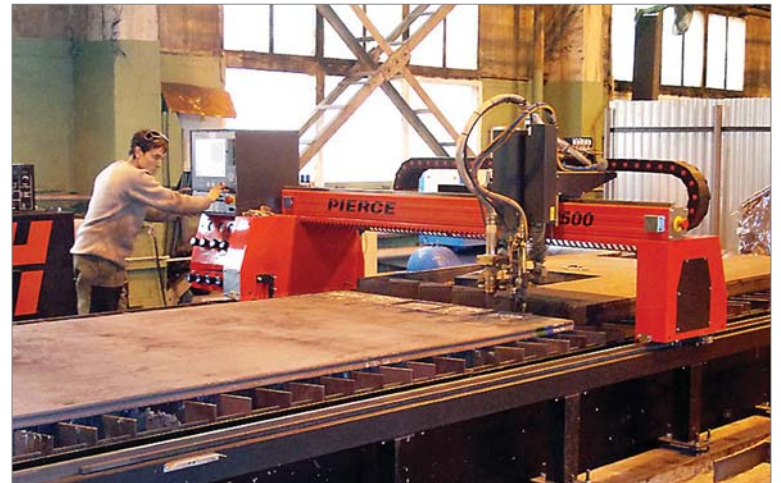
2012 год. В механолитейном цехе успешно работает установка термической резки металла.

Какой была середина осени в разные годы, легко вспомнить, обратившись к октябрьским номерам «Огнеупорщика».