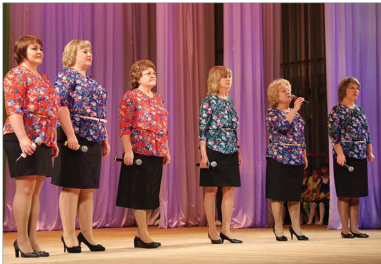
Поющие сотрудницы динасовских детсадов открывали фестиваль.

11 ноября в заводском Дворце прошёл 9-й открытый городской фестиваль хоров и ансамблей «Поющий край». Разновозрастные вокалисты, от детсадовцев до ветеранов, встречали тёплый приём у публики, которая умилилась, восторгалась и не жалела аплодисментов.