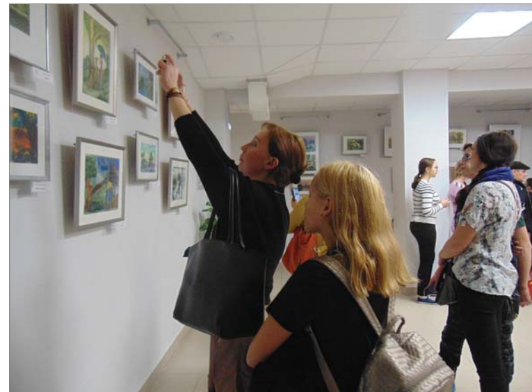
Посетители не скрывали восхищения.

- Задача каждого педагога – музыканта или художника – приобщать детей к музыке образов,