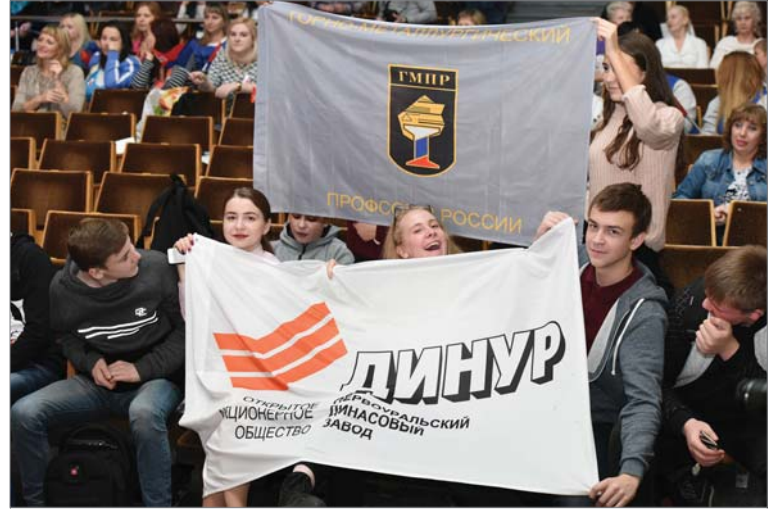
Группа поддержки «болела» за своих, как могла.

- После выступления подошли зрители — работники предприятий, приехавшие из других городов, и говорили, что их до слёз растрогала песня, так красиво дополненная танцем и профессионально созданным телевизионным сюжетом,