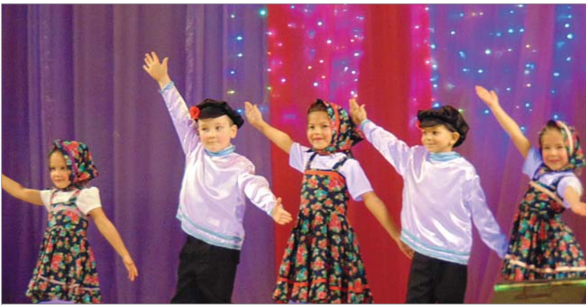
Малыши из детского сада №34 и их «Валенки».

- Нынешний, девятый по счёту «Данс-парад-2017» значительно отличается по географии участников: если в прошлом году было 18 коллективов и около 300 участников, то в этом году на сцене 23 коллектива и 484 участника. Особенность фестиваля в том, что вместе выступают известные студии, и те, что только набирают популярность.