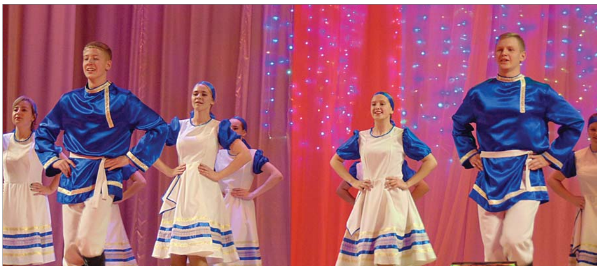
«Русский задорный» в исполнении участников студии «Вертикаль» из Центра дополнительного образования.

Каждому коллективу и руководителю наградой стали Благодарственные письма и грамоты, аплодисменты, цветы.