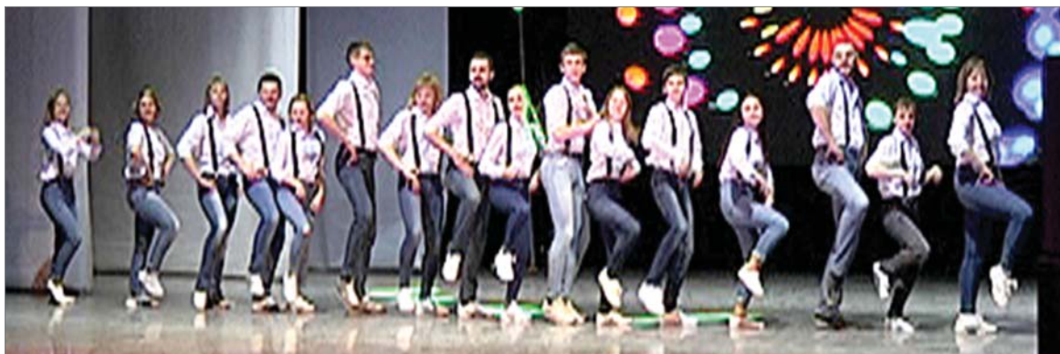
Заводчане подарили зрителям эмоции.