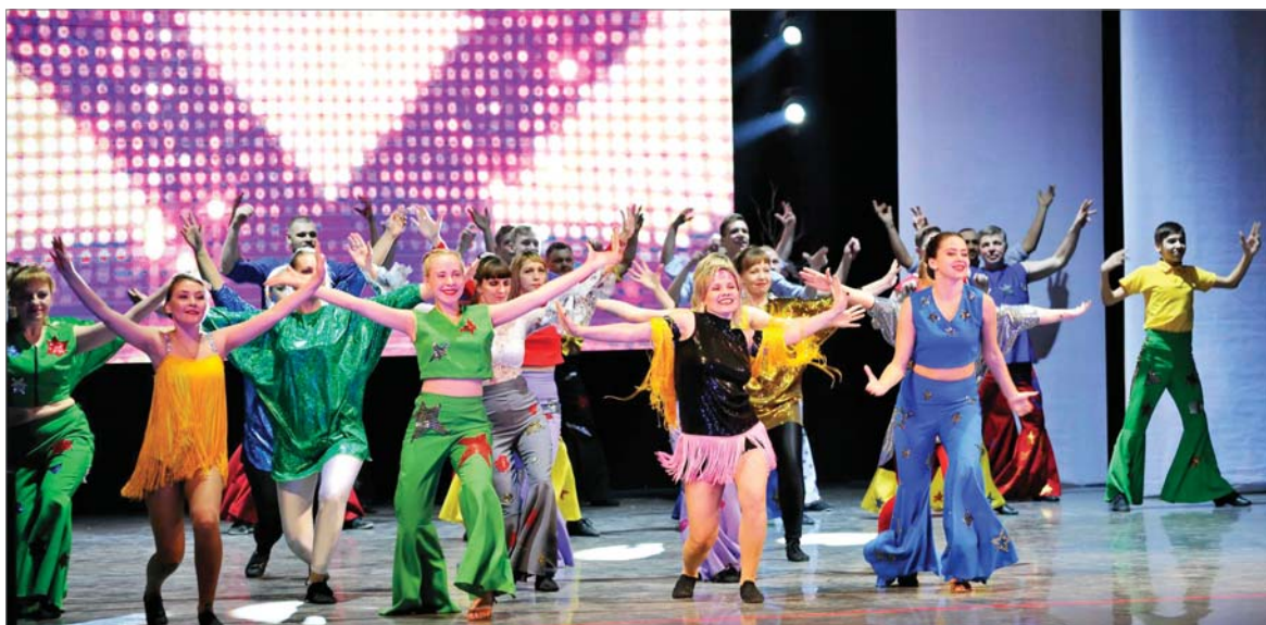
Зажигательный танец «Диско» от сборной «ДИНУРА».

Вне зависимости от решения жюри все конкурсанты ощутили подъём сил и эмоции.