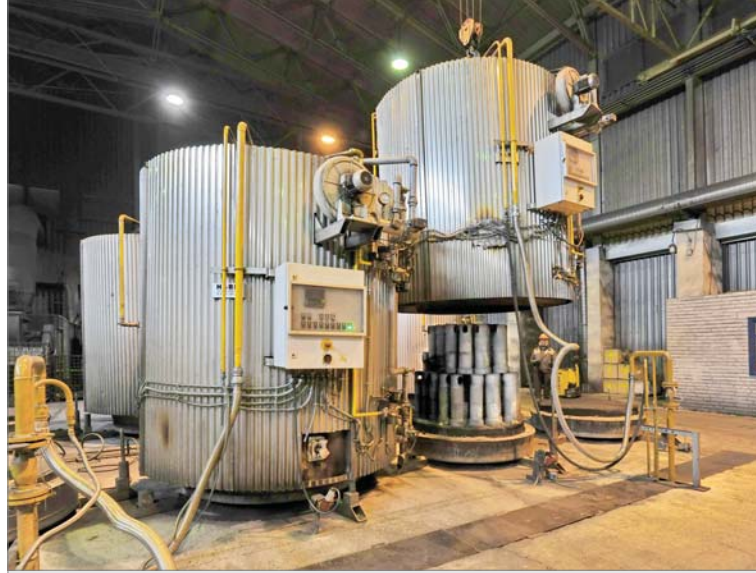
Когда-то термообработка была слабым звеном в технологической цепи изготовления корундографитовой продукции. Сейчас на участке уже десять колпаковых печей, позволяющих своевременно выполнять обжиг сформованных изделий.

виден. Подтянули выполнение всех показателей. Уже в мае очень неплохо отработали по уровню брака. На достигнутом не останавливались. За этот год внесли корректировки в технологические процессы, ужесточили требования к режиму обжига, изменили параметры зерновых составов исходного сырья — кварцита, добавили два дополнительных компонента в рецептуру.