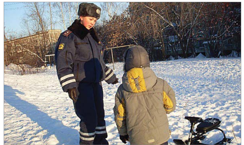
ГИБДД города Первоуральска

Если горки, накаты находятся на территории жилищного фонда, информацию необходимо направлять в соответствующие управляющие компании.