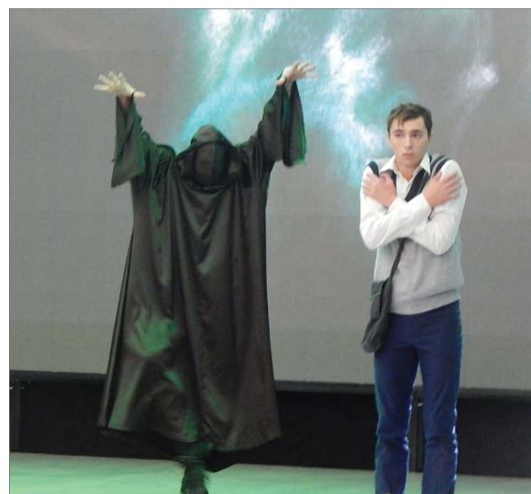
Автор материалов Екатерина ТОКАРЕВА Фото автора и Никиты СТАРКОВА

в ИКЦ можно увидеть 9,10 и 16 декабря, в 11 и 13 часов.