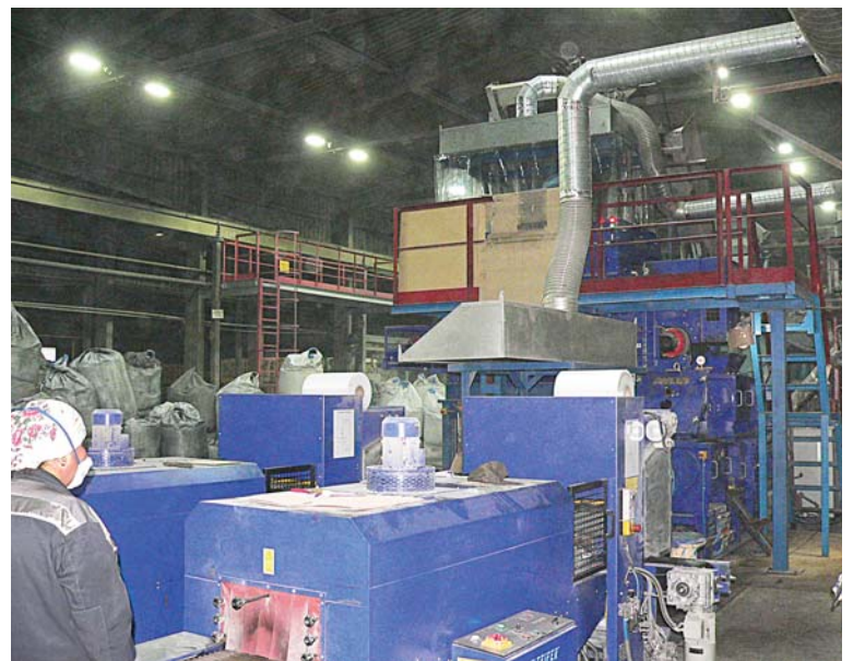
Линия по производству лёточных масс с новыми вытяжными системами.

Продукцию участка ждут Магнитогорский, Челябинский, Новолипецкий, Нижнетагильский металлургические комбинаты, казахстанское предприятие «АрселорМиттал Темиртау».