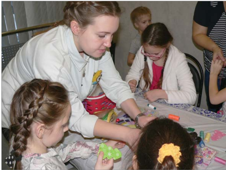
Не только сделать самой, но и поделиться секретами мастерства.

В исследованиях и экспериментах молодого инженера тоже немалая доля творчества.